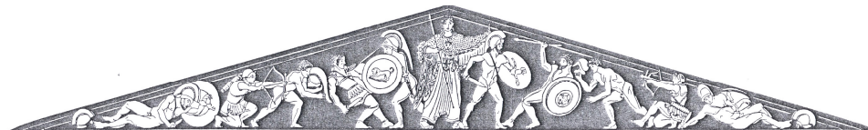
4 East pediment of the so-called Temple of Aphaia on Aegina. Reconstruction. After Furtwängler, Aegina (1906)

Ανατολικό αέτωμα του ναού της Αφαίας Αθηνάς, σχεδιαστική αναπαράσταση (1906).