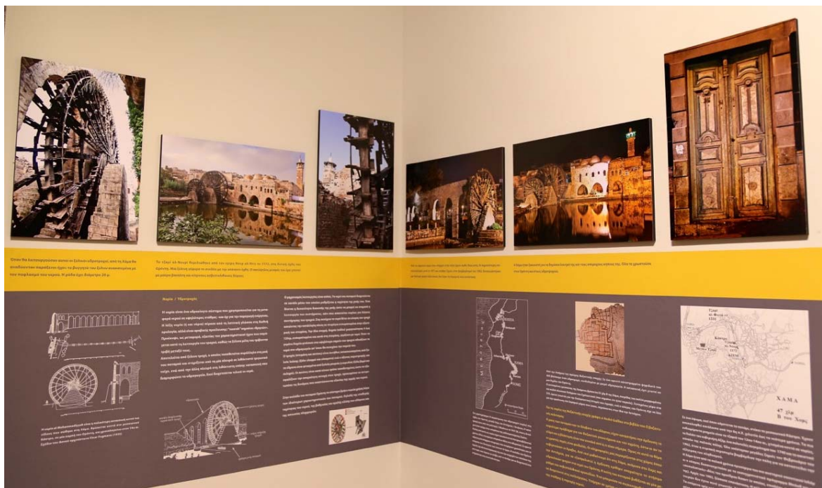
Η αίθουσα της Χάμα με τις νορίες της.

Η Χάμα, δροσερή, με κήπους και λουτρά, χτισμένη στις όχθες του Ορόντη ξεχώριζε για τους αιωνόβιους, τεράστιους, ξύλινους υδροτροχούς της (νορίες) και τα σπουδαία ψηφιδωτά. Εδώ βρίσκεται και το θαυμάσιο ψηφιδωτό με την συναυλία των έξι γυναικών, από μια βίλα στην εξοχή της Χάμα. Σχεδόν αισθάνεσαι την απόλαυση της μουσικής, τη χαρά της ζωής που αποπνέει. Είναι ένα από τα πολλά, απaráμιλλης τέχνης, ψηφιδωτά της Συρίας. Πού να σκορπίστηκαν άραγε οι ψηφίδες τους!