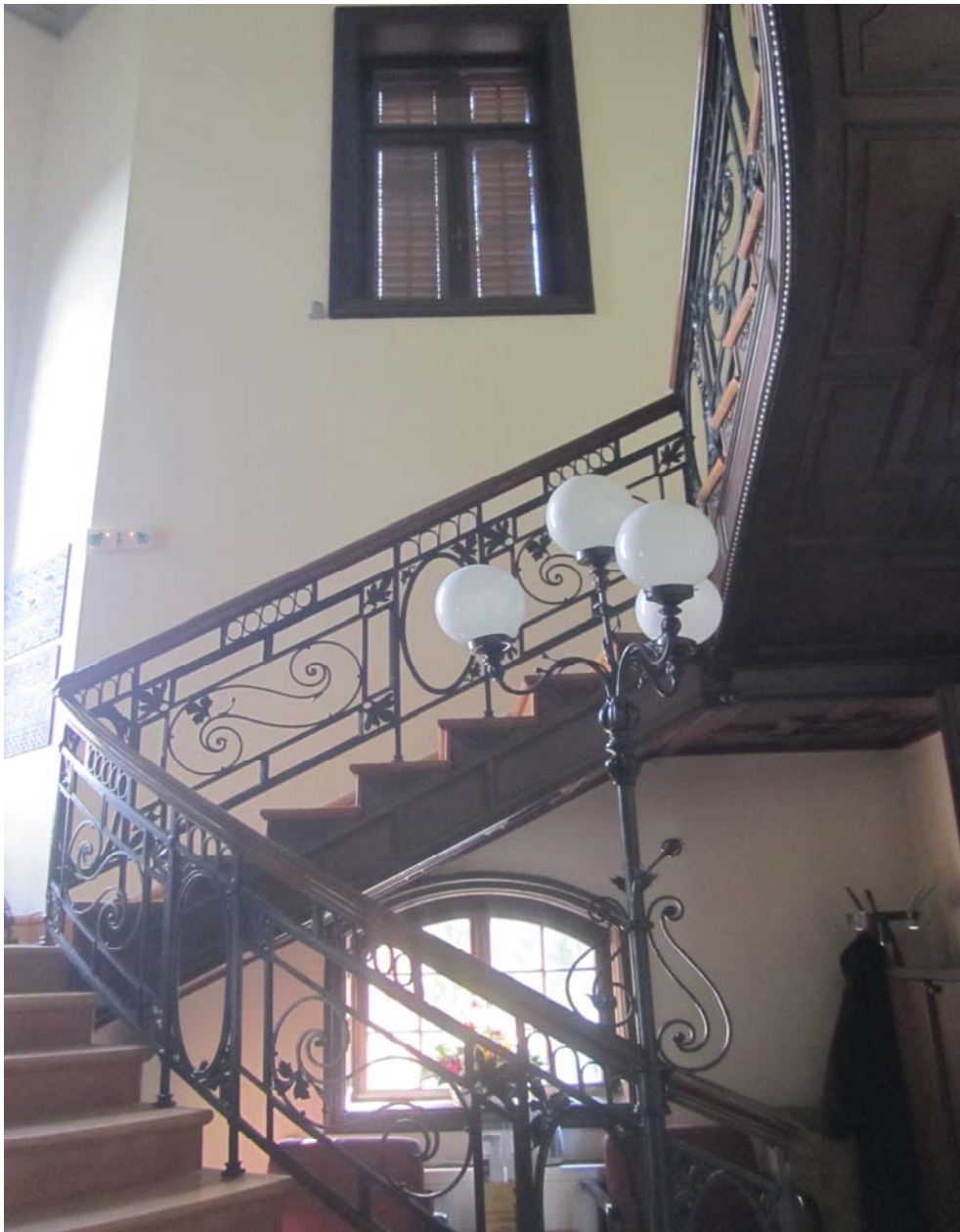
Εσωτερική σκάλα της βίλας Καπαντζή προς τον δεύτερο όροφο.

Με δυσκολία αποσπάται το μυαλό από την ονειροπόληση, για να συνοδεύσει το σώμα στον δεύτερο όροφο. Εδώ είναι το «βασιλείο» της Κοίλης Συρίας, του εύφορου δηλαδή τμήματος της χώρας στην κοιλάδα του ποταμού Ορόντη, που βρίσκεται βορείως της Δαμασκού: Χομς, Χάμα, Απάμεια και το μυθικό Χαλέπι. Κι ακόμη, σε αυτόν τον όροφο, συναντούμε τα περίτεχνα παλάτια των Ομαγιαδών στην έρημο, τα βυζαντινά καστρομονάστια και κάστρα που φύλαγαν τα περάσματα, με γνωστότερο εκείνο της Ζηνοβίας, της εποχής του Ιουστινιανού, τις βυζαντινές πολιτείες-φαντάσματα στα βορειοδυτικά του Χαλεπιού, με γνωστότερη την Σερτζίλα και τα ιστορικά χριστιανικά προσκυνήματα του Αγίου Συμεών του Στυλίτη και του Αγίου Σεργίου (Σεργιούπολη) στον βορρά της χώρας.