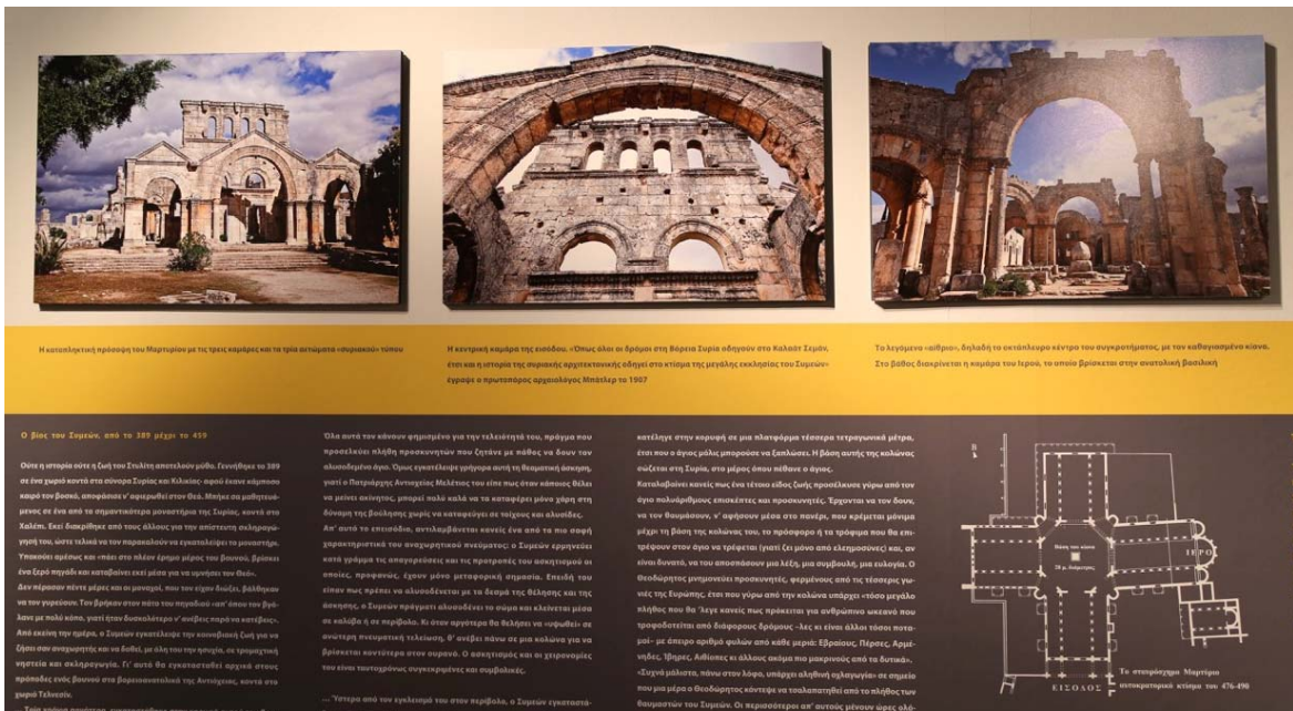
Η κατασκευή πρόδρομο του Μαρτυρίου με τις τρεις κρήνες και τα τρία αψιδωτά «φρονιολόγια» του.