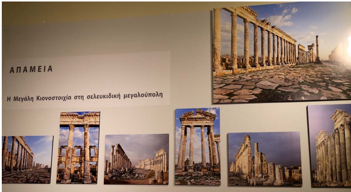
Η σελευκιδική Απάμεια με την εντυπωσιακή κιονοστοιχία της.

προετοιμασμένη για την αίσθηση που θα μου δημιουργούσε η Δαμασκός, το Χαλέπι και η Παλμύρα, αλλά καθόλου για την Απάμεια. Καμμιά φορά, σκέφτομαι, πρέπει ν' αφήνεσαι στην έκπληξη.