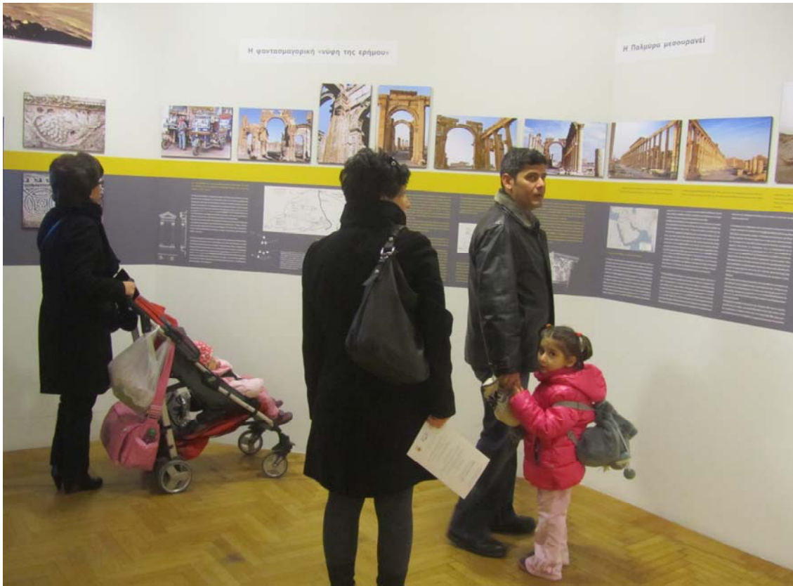
Επισκέπτες όλων των ηλικιών στην αίθουσα της θρυλικής Παλμύρας, με τις μνήμες της βασίλισσάς της Ζηνοβίας να πλανώνται.

Η Μαριάννα με τον νοσταλγικό, παθιασμένο, συναισθηματικά φορτισμένο λόγο της μας ταξιδεύει. Τα μάτια βλέπουν τις φωτογραφίες, διαβάζουν αποσπασματικά τα κείμενα, μα το μυαλό έχει ήδη πετάξει προς Ανατολάς. Βρίσκεται βυθισμένο στις μνήμες της χώρας που αγαπήσαμε, του λαού που αισθανθήκαμε τόσο κοντά μας. Θυμάμαι το ζεστό, φιλικό χαμόγελο των ανθρώπων, την ευγένεια, την απεριόριστη γενναιοδωρία και την έμφυτη φιλοξενία τους, το δέος στο πρώτο αντίκρουσμα της Παλμύρας, το εκτυφλωτικό φως της ερήμου, τη γοητεία της έναστρης λείλα, την μυρωδιά του αγχιστού τσαγιού με δυόσμο, την γεύση του καφέ με κάρδαμο, τα ηδονικά αρώματα των μπαχαρικών, το ξάφνιασμα των ματιών στη θέα του μοναδικού τζαμιού των Ομαγιαδών στη Δαμασκό, το ξάφνιασμα της ψυχής που έβλεπε να σμίγουν με ευλάβεια στον ιερό αυτό χώρο Χριστιανοί και Μουσουλμάνοι, Σουνίτες και Σίτες, στην αναζήτηση του Θείου. Κι ακόμη θυμάμαι την μαυλιστική αραβική μουσική σ' ένα καφεενδάκι της Δαμασκού, με το άρωμα από τους ναργιλέδες να γεμίζει την ατμόσφαιρα και την αίσθηση που μου προκάλεσαν η μαύρη, σαν αρνητικό φωτογραφίας Μπόζρα (πόσος ανθρώπινος μόχθος, αλήθεια, χρειάστηκε για να πελεκηθούν όλες αυτές οι θεόσκληρες, ηφαιστειακές πέτρες!), τα εκπληκτικά εκθέματα του μουσείου της Δαμασκού, τη γεύση του παγωτού με το πράσινο φυστίκι, στη σκεπαστή αγορά της Δαμασκού. Κι εκείνο το παιδόπουλο, με τα μάτια-κάρβουνα, που με κοιτούσε γελαστά και θαρρετά την ώρα που θαύμαζα την δεξιοτεχνία του μπακιρτζή πατέρα του.