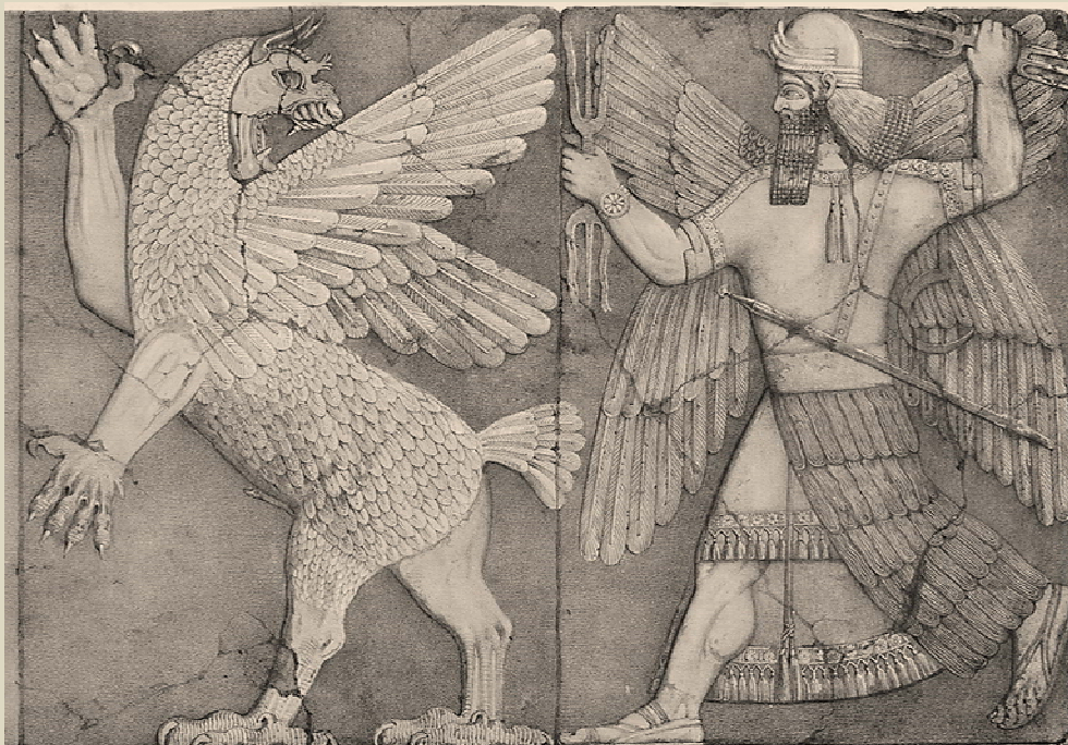
Ο θεός Ήλιος μάχεται με το τέρας Χάος

Κι εμείς θα 'χουμε να λέμε ότι βρεθήκαμε οκτώ ώρες μακριά από τη Μοσούλη, 408 χιλιόμετρα απόσταση, δυο ημέρες πριν από τη νέα τραγωδία που διαδραματίζεται στον Τίγγρη.