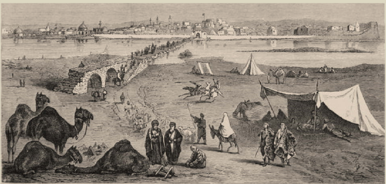
John Philip Newman: Η Μοσούλη στην αριστερή όχθη του Τίγρη, 1876

Οι απηνείς διώξεις που οργάνωσε η Οθωμανική Αυτοκρατορία το 1915, ταυτόχρονα με τον Διωγμό των Αρμενίων, αποδεκάτισαν όλον αυτό τον χριστιανικό κόσμο του Βόρειου Ιράκ (Βιλαέτι της Μοσούλης). Οι ελάχιστοι που απέμειναν, ύστερα από συνεχείς περιπέτειες, αναγκάστηκαν να εγκαταλείψουν την περιοχή το 2003. Οι ανατροπές που επέφερε η Αμερικανική εισβολή άλλαξαν τον χριστιανικό χάρτη της Μέσης Ανατολής, εκτός των τόσων άλλων ανατροπών.