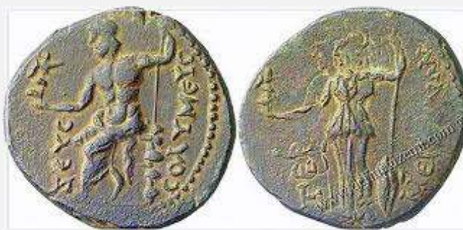
Εικ. 2: Νόμισμα του 1ου αι. μ.Χ. που βρέθηκε στην Τερμησό. Στη μία όψη εικονίζεται ο Δίας ἔνθρονος κρατώντας Νίκη, με την επιγραφή: ZEYS COΛYMEYS. Στην ἄλλη όψη στέκεται η Αθηνά κρατώντας Νίκη, με την επιγραφή: / TEP / MEIZONΩN. Συνολικά βρέθηκαν μέχρι σήμερα στην Τερμησό 12 νομίσματα.

Οι Σόλυμοι ήταν οι κάτοικοι της περιοχής και αυτή είναι η αρχαιότερη αναφορά σ' αυτούς στο έπος του Ποιητή. Ο Στράβων, πολλούς αιώνες αργότερα, αναφέρει ότι «... καὶ αὐτοὶ δὲ οἱ Τερμησεῖς Σόλυμοι καλοῦνται», ὅπως και ο «ὑπερκεῖμενος λόφος καλεῖται Σόλυμος...» ( Γεωγραφικά , II', 16). Σε νόμισμα που βρέθηκε στην Τερμησό εικονίζεται από τη μία πλευρά ο θεός Ζεὺς με την επωνυμία Σολυμεύς, ο οποίος λατρευόταν στην πόλη. Υπήρχε και ναός μεγαλοπρεπής προς τιμὴν του, που μόνο λίγα ερείπια στέκουν σήμερα για να τον θυμίζουν.