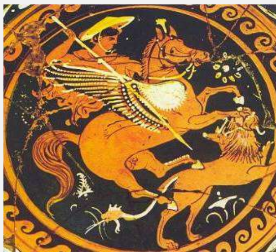
Εικ. 1: Καβάλα στον Πήγασο ο Βελλεροφόντης επιτίθεται με το δόρυ κατά της Χίμαιρας. Στη φοβερή μορφή της ενώνονται ένα λιοντάρι, μια κατσίκα κι ένα φίδι για ουρά (2ος αι. π.Χ.). Τάραντας, Museo Nazionale Archeologico ( http://cir.campania.beniculturali.it )

«δεύτερον ... ἐπολέμησε τούς δοξαστούς Σολύμους, κι εἰς μάχην τόσον τρομερήν δέν εἶχεν ἔμπει ἀκόμη»