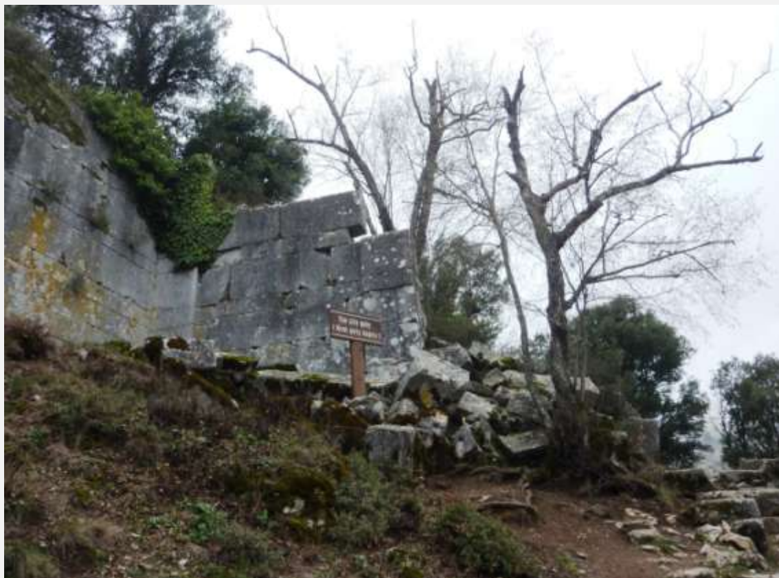
Φωτ. 4: Η Πύλη στα δεξιά και τμήμα του εξωτερικού τείχους στα αριστερά.

Με αυτές τις σκέψεις φτάνω σ' ένα μικρό πλάτωμα. Βρίσκομαι μπροστά στην Πύλη της πόλης. Αριστερά μου αντικρίζω τα πρώτα απομεινάρια του εξωτερικού τείχους. Κοιτάζω το σχεδιάγραμμα που κρατώ, προσπαθώντας να προσανατολιστώ στο χώρο. Στέκομαι στην ανατολική Πύλη. Στα νοτιοανατολικά της πάνω στο τείχος υπάρχουν χαραγμένες κάποιες προφητείες, σύμφωνα με τις σημειώσεις μου. Δυσκολεύομαι να τις εντοπίσω.