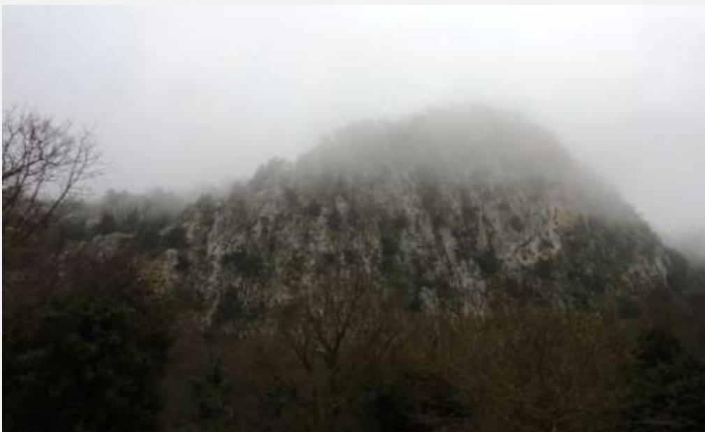
Φωτ. 2: Θεόρατοι πέτρινοι ὄγκοι μας περιτριγυρίζουν. Οἱ κορυφές τοὺς χάνονται στὴν ομίχλη...

Οἱ λέξεις «ὑπερύψηλον», «ἀπότομον», «χαλεπή» κλωθογυρίζουν στο μυαλό μου. Τὸ αυτοκίνητο ἀγκομαχώντας καὶ με χαμηλές ταχύτητες συνεχίζει ν' ανεβαίνει τὸν ορεινὸ δρόμο. Κάποτε φτάνουμε στὸν προορισμό μας. Τὰ σύννεφα ἔχουν κατέβει χαμηλότερα, μὴν ἀποκλείοντας τὸν κίνδυνο κάποιας ξαφνικῆς νεροποντῆς. Σ' αὐτὸ τὸ υψόμετρο ὁ καιρὸς εἶναι ἀσταθῆς καὶ μὲς μπορεῖ νὰ ξεσπάσουν ἀπόμετα, ἀπὸ στιγμή σὲ στιγμή. Κοιτῶ γύρω μου καὶ παρατηρῶ θεόρατους πέτρινους ὄγκους νὰ μας περιτριγυρίζουν. Οἱ κορυφές τοὺς μόλις ποὺ φαίνονται, καθὼς πυκνὴ ομίχλη τὶς ἔχει καλύψει.