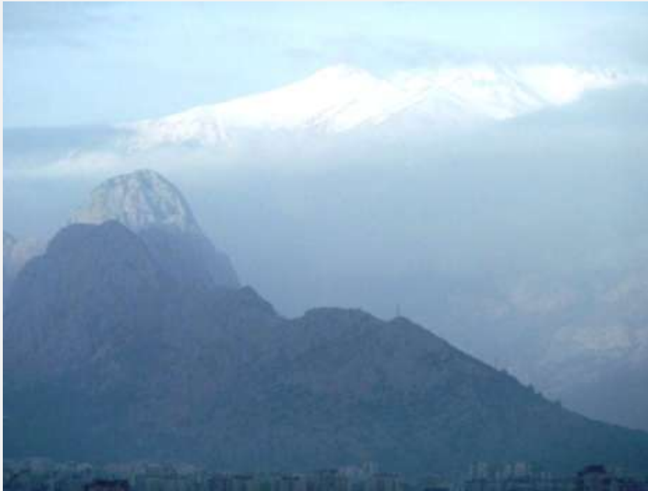
Φωτ. 1: Η χιονισμένη κορυφή του Ολύμπου της Λυκίας, στα δυτικά της Αττάλειας.

Περίπου 34 χιλιόμετρα βορειοδυτικά από την Αττάλεια απέχει η αρχαία πόλη της Τερμησσού –ο προορισμός μας–, σκαρφαλωμένη ως αετοφωλιά στο όρος Σόλυμνος (σήμερα Güllük Dağı, 1.665 μ. υψόμετρο), που αποτελεί τμήμα της οροσειράς του Ταύρου. Της οροσειράς που διαμορφώνει και χαρακτηρίζει τη γεωμορφολογία όλης της νότιας Τουρκίας, του μεγάλου φυσικού εμποδίου που δυσχεραίνει την επικοινωνία ανάμεσα στη μικρασιατική ενδοχώρα, την «εντός του Ταύρου Ασία» σύμφωνα με τον Στράβωνα, και την παραλιακή αλλά ορεινή ζώνη, την «εκτός του Ταύρου Ασία».