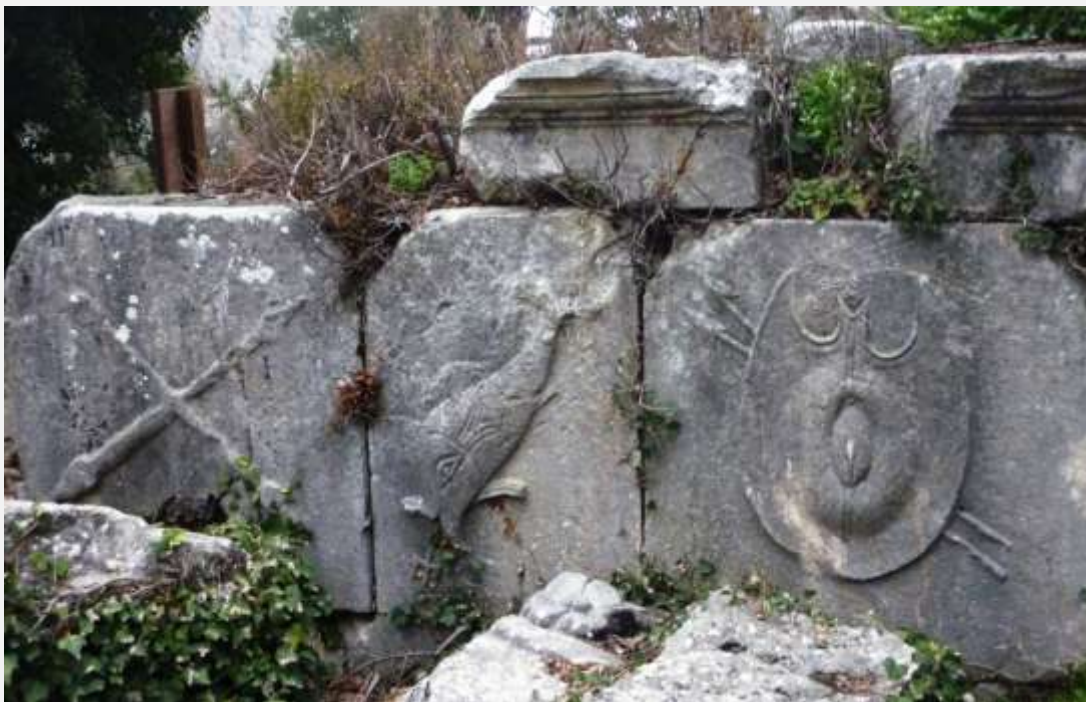
Φωτ. 8: Το ανάγλυφο δελφίνι (ή μήπως ψάρι;) ανάμεσα στα όπλα και την ασπίδα.

Ξαφνικά βρίσκομαι μπροστά σε ένα απρόσμενο ανάγλυφο στη βάση κάποιου τύμβου (;). Ένα δελφίνι (στα δικά μου μάτια) ξεπροβάλλει ανάμεσα σε μια ασπίδα και τα όπλα πιθανόν κάποιου πολεμιστή. Το θαλασσινό θέμα με εντυπωσιάζει καθώς προσπαθώ να σκεφτώ τη σχέση του νεκρού με τη θάλασσα, πάνω σ' αυτόν τον ορεινό τόπο. Τροφή για σκέψη και αναζήτηση.