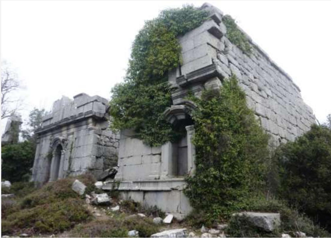
Φωτ. 5: Κτίριο του Γυμνασίου.

Εντυπωσιασμένοι φαίνονται και οι υπόλοιποι συνταξιδιώτες μου, καθώς έχουν ήδη φτάσει και περιπλανώνται στο χώρο. Αφήνουμε το Γυμνάσιο και ακολουθώντας το μονοπάτι με πορεία νότια-νοτιοανατολική προχωράμε για να επισκεφθούμε το Θέατρο. Είναι κτισμένο ανατολικά της αρχαίας Αγοράς. Συνεχίζουμε περπατώντας πάνω σε πλακόστρωτο δρόμο της πόλης. Η υγρασία έχει κάνει τις πέτρες γλιστερές και κάθε μας βήμα πρέπει να είναι προσεχτικό. Χάσματα από αρχαία πηγάδια και από το αποχετευτικό σύστημα της Τερμησσού ανοίγονται σε κάθε μας βήμα.