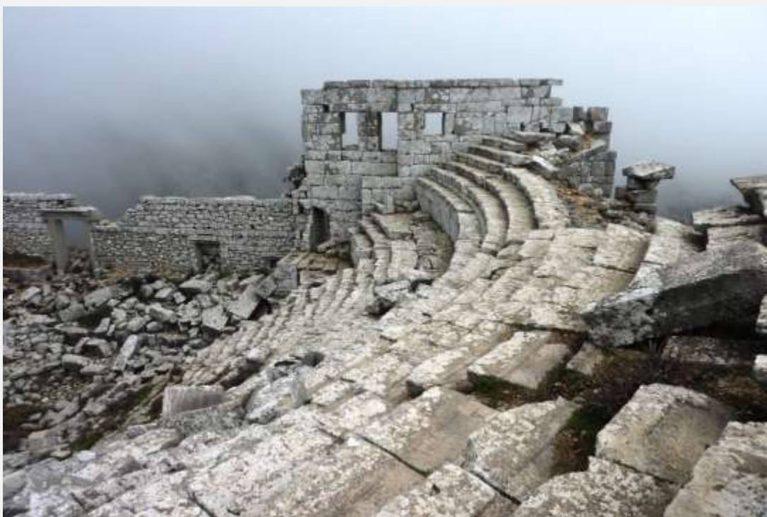
Φωτ. 7: Η νότια πλευρά του Θεάτρου. Διακρίνεται τμήμα των κερκίδων και της σκηνής. Και η ομίχλη παντού γύρω μας.

Το φως άρχισε να λιγοστεύει και σε λίγο ο αρχαιολογικός χώρος θα κλείσει. Είμαστε οι τελευταίοι και μοναδικοί επισκέπτες την ώρα αυτή. Ο φύλακας που μας ακολούθησε μέχρι εδώ πάνω δείχνει ανήσυχος και βιαστικός. Μου κάνει νόημα ότι πρέπει να φύγουμε και αναγκαστικά τον ακολουθώ. Δυστυχώς ο χρόνος είναι ελάχιστος και έτσι δεν θα μπορέσουμε να δούμε τη Νεκρόπολη με τις σαρκοφάγους και τους κτιστούς τάφους που απλώνεται στα νοτιοδυτικά της Τερμησσού. Ο χώρος χρειάζεται να του αφιερώσεις περισσότερο χρόνο για περπάτημα και εξερεύνηση.