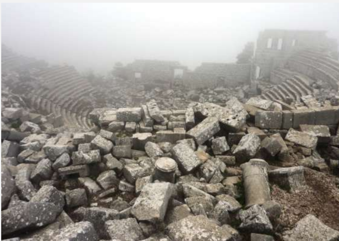
Φωτ. 6: Το Θέατρο καλυμμένο από ομίχλη.

Αναμφίβολα το κτίριο του Θεάτρου είναι από τα οικοδομήματα της Τερμησσού που αιχμαλωτίζουν τη ματιά και τη σκέψη σου. Η περίοπτη και μοναδική θέση του είναι εκείνη που το κάνει να ξεχωρίζει ανάμεσα στα υπόλοιπα θέατρα του αρχαίου κόσμου. Από αρχιτεκτονικής άποψης έχει όλα τα χαρακτηριστικά των ρωμαϊκών θεάτρων, διατηρώντας παράλληλα το ελληνιστικό του σχέδιο. Μια μεγάλη οδός συνέδεε παλαιότερα το Θέατρο με την Αγορά, στα δυτικά. Οι κερκίδες χωρίζονται από ένα διάζωμα, ενώ η χωρητικότητά του υπολογίζεται ότι ήταν περίπου 4.000-5.000 θεατών.