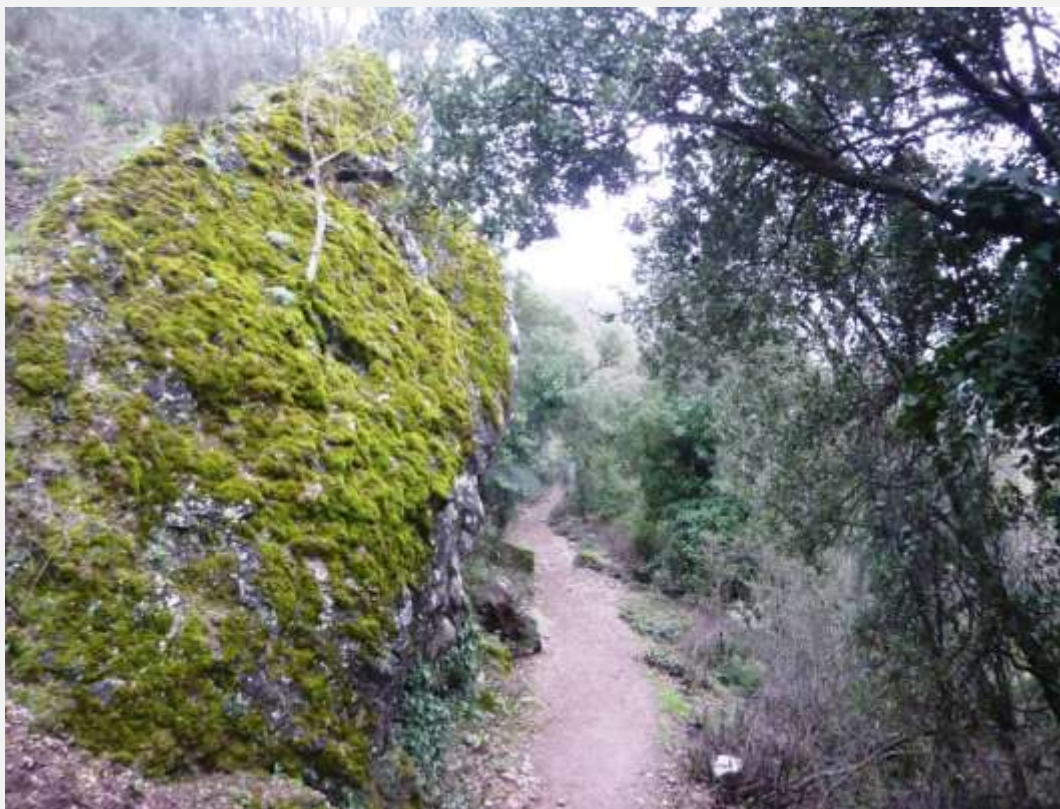
Φωτ. 3: Το ανηφορικό μονοπάτι που οδηγεί στον αρχαιολογικό χώρο της Τερμησσού.

Η ταξιδιωτική ομάδα σε λίγο αρχίζει να ανηφορίζει το μονοπάτι που οδηγεί στον αρχαιολογικό χώρο της Τερμησσού. Πολύ σύντομα προηγούμαι της συντροφιάς και βρίσκομαι να προχωρώ μόνος μου. Κουραστική η πορεία. Ανασαίνω βαθιά και στέκομαι. Ο ιδρώτας τρέχει στο μέτωπό μου. Ακούω τους χτύπους της καρδιάς μου. Γαλήνη και γλύκα, ο υγρός αέρας μοσκοβολούσε από τις μυρωδιές της γης, τα σάπια φύλλα και τη φρέσκια βλάστηση. Μεγάλα πουρνάρια μπερδεύονται πού και πού με αγριελιές σκαλωμένες σε βράχια. Στα δεξιά μου ανοίγεται η απότομη χαράδρα. Σε κάθε στροφή του μονοπατιού ψάχνω για ίχνη κατοίκησης ή για κάποιο στοιχείο που θα μαρτυρεί ότι έφθασα στον προορισμό μου. Σταματώ και αφουγκράζομαι. Ο άνεμος μεταφέρει, ως μακρινούς απόηχους, τους ψίθυρους της ομάδας και τα βήματά τους, καθώς ακολουθούν αρκετά πίσω μου.