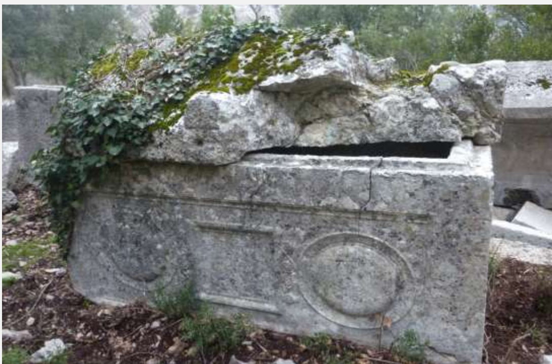
Φωτ. 9: Σαρκοφάγος με ανάγλυφα διακοσμητικά σχέδια – ο κισσός ερωτοτροπεί με τη λαξευμένη πέτρα.