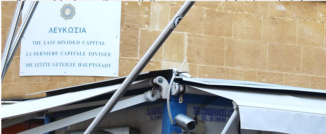
«ΛΕΥΚΩΣΙΑ. Η ΤΕΛΕΥΤΑΙΑ ΧΩΡΙΣΜΕΝΗ ΠΡΩΤΕΥΟΥΣΑ»

Παρακαλούμε να ληφθεί υπόψη ότι το πέρασμα στην Κατεχόμενη από το 1974 πλευρά της Κύπρου είναι για όλους μία οδυνηρή εμπειρία. Όποιος δεν έχει τις δυνάμεις να την αντέξει, δεν θα πρέπει να έρθει στο ταξίδι –ή, θα μπορεί να συμμετάσχει, για να γνωρίσει την Ελεύθερη Κύπρο, και να μην ακολουθήσει στα Κατεχόμενα. Να μην περάσει τα φρικτά Οδοφράγματα. Καλό θα είναι να μας το δηλώσει εγκαίρως.