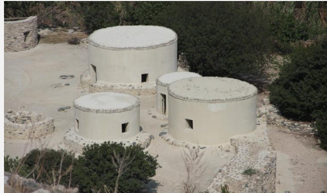
Χοιροκοιτία, αναπαράσταση των κυκλικών κτισμάτων και της οχύρωσης του 7000 π.Χ.