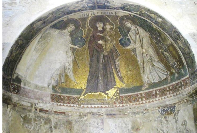
Η μεσοβυζαντινή Παναγία η Αγγελόκτιστη με το ψηφιδωτό του δέκατου αιώνα