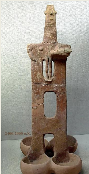
< Μητέρα με παιδί. Κουροτρόφος (;). Ειδώλιο της Μέσης εποχής του Χαλκού. Αρχαιολογικό Μουσείο, Λευκωσία

«Η Αρακιότισσα κε Καιχαριτωμένη» έργο του αγιογράφου Θεόδωρου του Αψευδή στη Μονή της Παναγίας του Άρακα στα Λαγουδερά. Στο Τρόδος. > Η εκκλησία είναι κατάγραφο με εξαιρε- τικής τέχνης τοιχογραφίες, δαπάνη του Λέοντος του Αυθέντη το 1192.