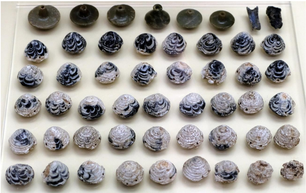
Αρχαιολογικό Μουσείο Μυκηνών