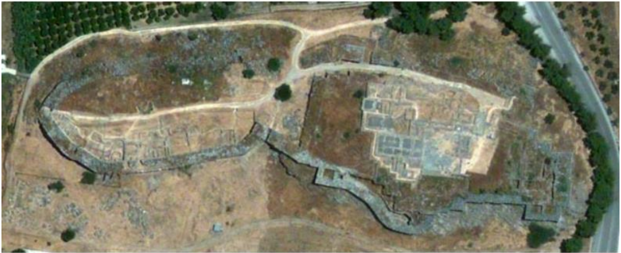
Τίρυνθα. Αεροφωτογραφία του αρχαιολογικού χώρου