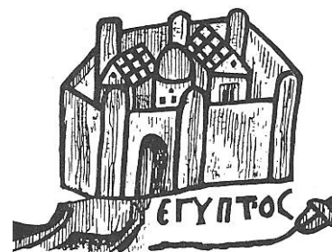
Το Κάστρο της Βαβυλώνας σε πρωτοβυζαντινό ψηφιδωτό

Ξεναγεί η Μαριάννα Κορομηλά Συνοδεύει η Εύα Βόγια Συνοδεύει επίσης τοπικός αγγλόφωνος ξεναγός