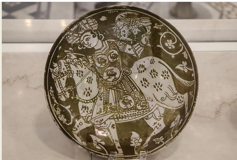
Κυνηγός με γεράκι σε πιάτο της Φατιμιδικής εποχής, 12ος αι.. Στο ΜΙΑ

Το μυθιστόρημα χαρτογραφεί την άνοδο του Σαλαντίν και την αναγόρευσή του σε σουλτάνο της Αιγύπτου και της Συρίας και τον ακολουθεί καθώς ετοιμάζεται, συμμαχώντας με τους Εβραίους και Χριστιανούς υπηκόους του, να πάρει πίσω την Ιερουσαλήμ από τους Σταυροφόρους. Φυσικά, είναι μια μεσαιωνική ιστορία, αλλά θα φανεί εκπληκτικά οικεία σε όσους παρακολουθούν τα γεγονότα στις μεγάλες σύγχρονες πόλεις Κάιρο, Δαμασκό και Βαγδάτη. Προδομένες ελπίδες, απογοητευμένοι στρατιώτες και αναξιόπιστες συμμαχίες συνθέτουν τη ραχοκοκαλιά του Βιβλίου του Σαλαντίν ».