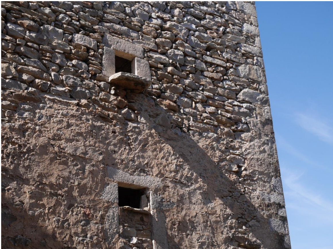
ΠΥΡΓΟΙ ΛΕΓΕΝΤΟΚΟΡΜΟΙ, ΕΥΘΥΤΕΝΕΙΣ, ΑΛΥΓΙΣΤΟΙ