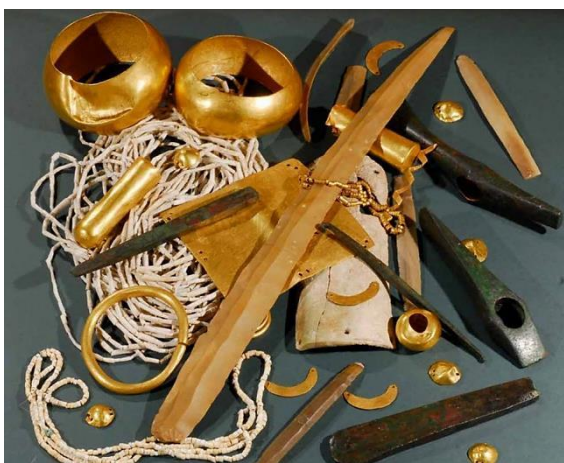
Σκήπτρο (κάτω) και άλλα πολυτελή αντικείμενα από τη χαλκολιθική Νεκρόπολη της Βάρνας (γύρω στο 4500 π.Χ.).

Τα μουσεία διαθέτουν πλουσιότερες συλλογές εξαιρετικά ενδιαφέρουσες. Το δε Αρχαιολογικό της Βάρνας με τα εκατοντάδες ευρήματα από τη Νεκρόπολη της Χαλκολιθικής εποχής (5η χιλιετία) είναι καταπληκτικό. Όπως και το ιστορικό κέντρο της λιμανούπολης με τα νεομπαρόκ και νεοροκοκό σπίτια. Αλλά και η Συλλογή Βυζαντινών Εικόνων στην Κρύπτη του Αλέξανδρου Νιέφσκι στη Σόφια έχει αριστουργήματα. Πολλά προέρχονται από τα βυζαντινά εργαστήρια της Μεσημβρίας. Σε ότι αφορά στον θρακικό πολιτισμό, μένει έκθαμβος κανείς από τον χρυσάργυρο πλούτο στα μουσεία της Σόφιας, της Βάρνας κλπ.