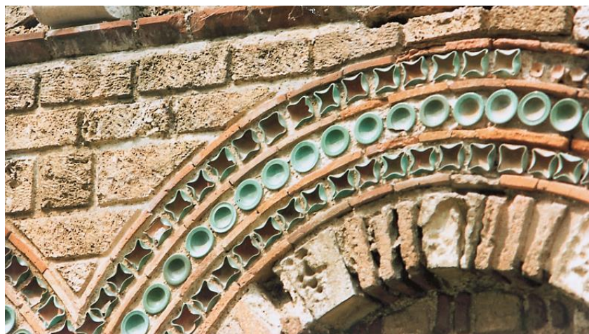
Από την Παλαιολόγια εποχή της βυζαντινής Μεσημβρίας.

Οι ταξιδιώτες θα λάβουν τις πρώτες Σημειώσεις με μείλ στις αρχές Ιουλίου, για καλοκαιρινό διάβασμα! Αλλά τον Ιούλιο θα αρχίσει και η δημοσίευση στο Αρχείο μας πολλών θεμάτων σχετικά με τη Βουλγαρία, η οποία ετοιμάζεται εδώ και καιρό. Θα μπορείτε, λοιπόν, να ταξιδέψετε και μέσα από το πλουσιότερο αρχειακό υλικό μας. Για τα Βαλκάνια από την Ύστερη Οθωμανική εποχή μέχρι τους Βαλκανικούς Πολέμους, μπορείτε να παρακολουθήσετε τις τέσσερις διαλέξεις που έκανε ο Κώστας Καραμαλής στο Πανόραμα το 2012 στην Οπτικοακουστική Βιβλιοθήκη του Ιδρύματος Μποδοσάκη. Σας συνδέουμε με την πρώτη διάλεξη http://www.blod.gr/lectures/Pages/viewlecture.aspx?LectureID=557