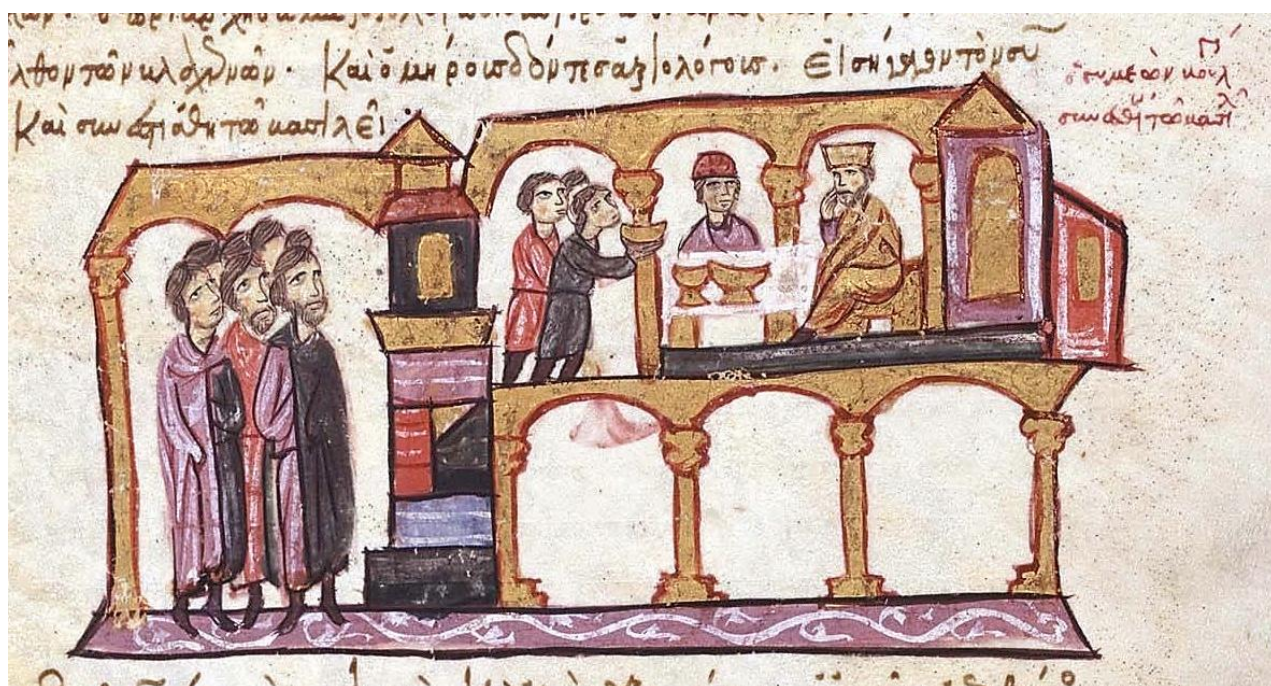
Ο Κωνσταντίνος Ζ΄ ο Πορφυρογέννητος υποδέχεται τον τσάρο των Βουλγάρων Συμεών

Με άλλα λόγια, όλη η φετινή άνοιξη είναι αφιερωμένη στη βυζαντινή χιλιετία!