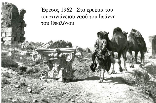
Έφεσος 1962 Στα ερείπια του ιουστινιάνειου ναού του Ιωάννη του Θεολόγου

Το αναλυτικό πρόγραμμα είναι έτοιμο. Δηλώστε αν θέλετε να σας το στείλουμε.