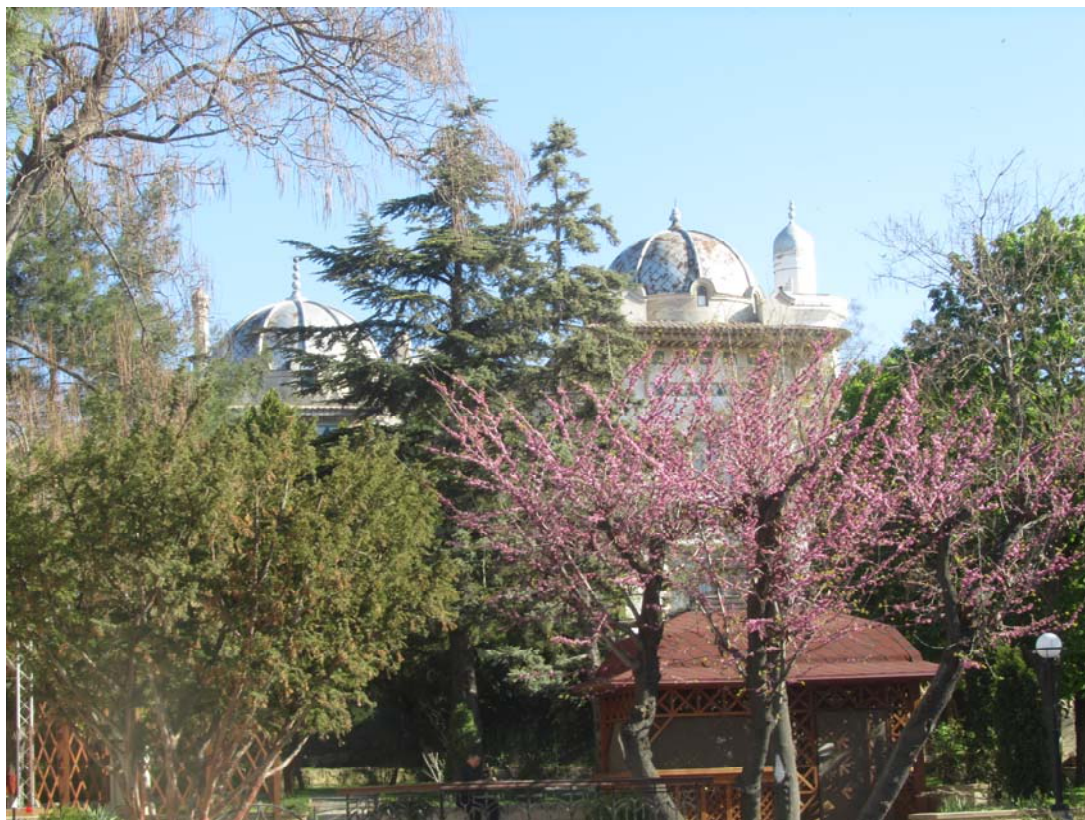
Η άνοιξη αγκαλιάζει στοργικά τα απομεινάρια του (πρόσφατου ελληνικού) παρελθόντος της Θεοδοσίας

Σε αυτό το σκλαβοπάζαρο μπορεί να πουλήθηκε από τους Τατάρους, που την είχαν απαγάγει τον 16 ο αιώνα, και η ρωσίδα Ρωξελάνη, η μετέπειτα πολυαγαπημένη σύζυγος Χιουρέμ του σουλτάνου Σουλεϊμάν του Μεγαλοπρεπούς. Η τύχη της, φωτεινή εξαίρεση σε σχέση με την τύχη που είχαν οι μυριάδες άλλοι σκλάβοι που πουλήθηκαν σε τούτο το λιμάνι σαν ένα κομμάτι κρέας.