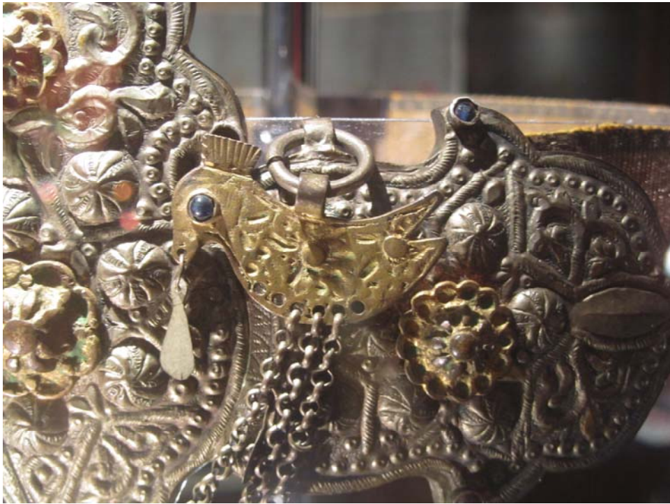
Εθνογραφικό Μουσείο Σιμφερόπολης. Λεπτομέρεια πόρτης

συγκινητικό να διαπιστώνεις πόσο ίδια με τα δικά μας ήταν πολλά, ταπεινά αντικείμενα καθημερινής χρήσης. Πόσο κοινές είναι οι βιοτικές ανάγκες των ανθρώπων. Πόσο έντονη η επιθυμία του ανθρώπου να ομορφαίνει την καθημερινότητά του. Ακόμα και τα πιο απλά αντικείμενα, από τα χαλκώματα και τα κεραμικά μέχρι τα στρωσίδια και τα ξυλόγλυπτα, μπορεί να μεταμορφώνει σε πραγματικά έργα τέχνης, κάθε φορά με την προσωπική σφραγίδα του τεχνίτη-καλλιτέχνη. Είναι να σε πιάνει μελαγχολία στη σκέψη ότι στη σημερινή εποχή η δήθεν πρακτικότητα και η τυποποίηση έχουν εκτοπίσει την διαφορετικότητα και την ζεστασιά που αποπνέουν τα χειροποίητα αντικείμενα.