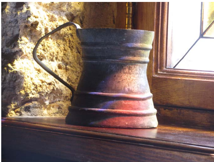
Πόσο μοιάζουν οι λύσεις που δίνουν οι άνθρωποι στις ανάγκες τους