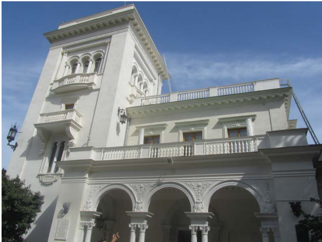
Γιάλτα, το ανάκτορο Λειβαδιά του Λάμπρου Κατσώνη, του τσάρου Νικολάου Β΄, της Συμφωνίας της Γιάλτας

Ανάκτορο Αλούπκα, Γιάλτα. Γλυσίνες, σαν περιδέριαι στο λαιμό της κορυφής Άι-Πετρί. Ακόμη θυμάμαι την ευωδιά τους