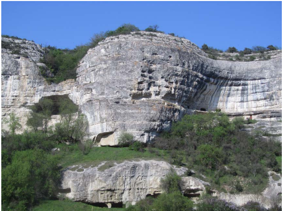
Προς το Τσουφούτ Καλέ. Ένα λίθινο «αερόστατο»