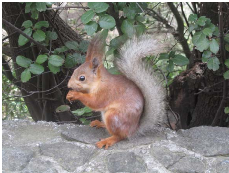
Σκιουράκι στους κήπους του ανακτόρου Αλούπκα, υποδέχεται τους ξετρελαμένους φωτογράφους