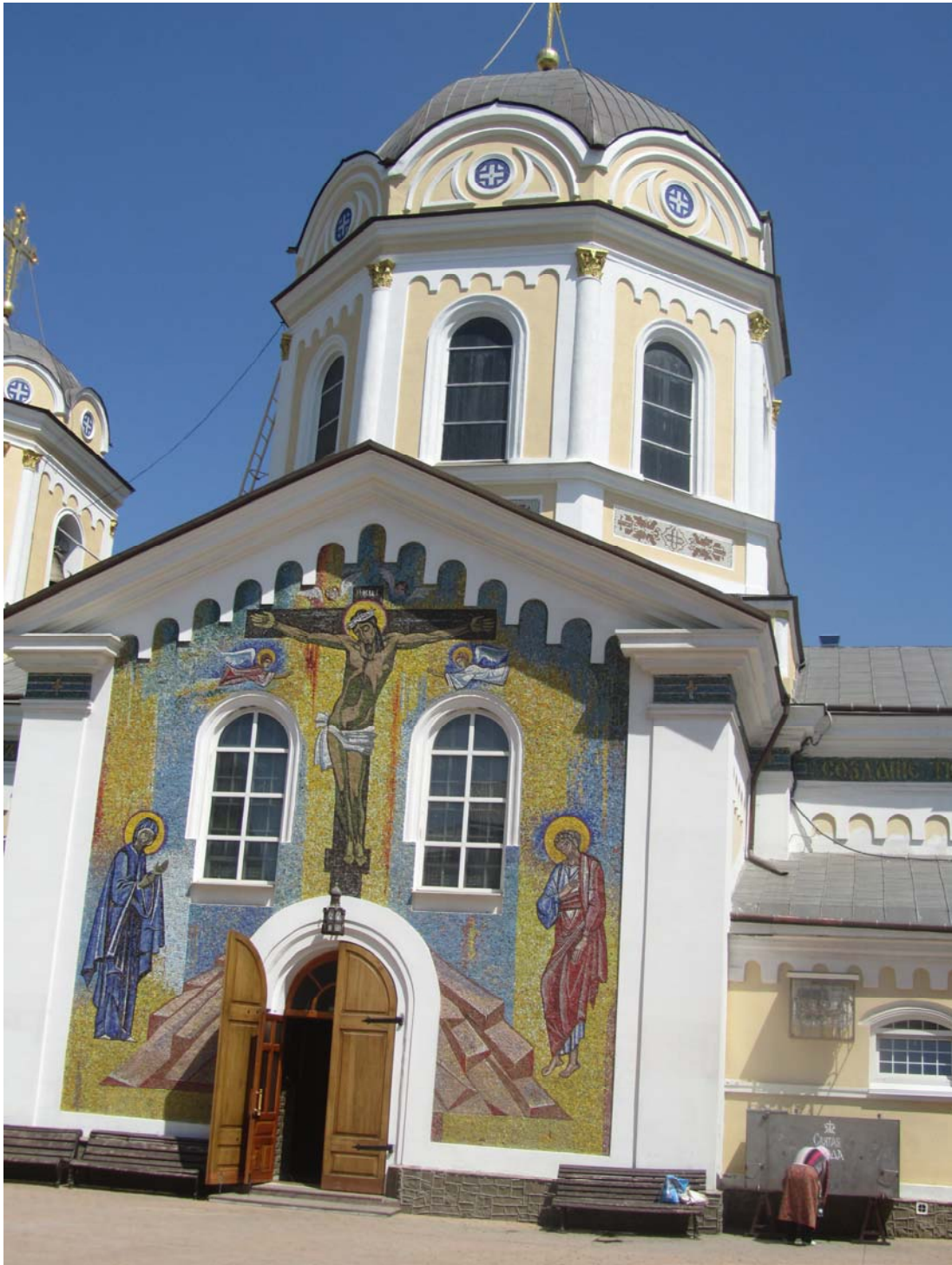
Σιμφερόπολη. Ο ναός της Αγίας Τριάδας φυλάει στοργικά το σκήνωμα του Αγίου Λουκά