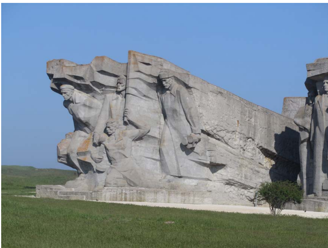
Μνημείο Adzhimushkai. Ο σημαιοφόρος λαβώθηκε, αλλά η σημαία συνεχίζει να κυματίζει

Συνήθως τα καλλιτεχνικά έργα του σοσιαλιστικού ρεαλισμού δεν μου αρέσουν. Αυτό όμως το μνημείο στην είσοδο των «κατακομβών» έξω από το Κέρτς, αφιερωμένο στους ηρωικούς υπερασπιστές του που έζησαν 170 ολόκληρες ημέρες χωρίς το φώς του ήλιου και με ελάχιστη τροφή και νερό πριν παραδοθούν, με συγκίνησε. Απέπνεε έναν δυναμισμό και ταυτόχρονα μια ήρεμη αποφασιστικότητα. Ο γονατισμένος σημαιοφόρος που ακόμα κρατάει υψωμένη την σημαία της αντίστασης εναντίον του εχθρού φάνταζε σαν σύμβολο του μεγαλείου της ανθρώπινης ψυχής.