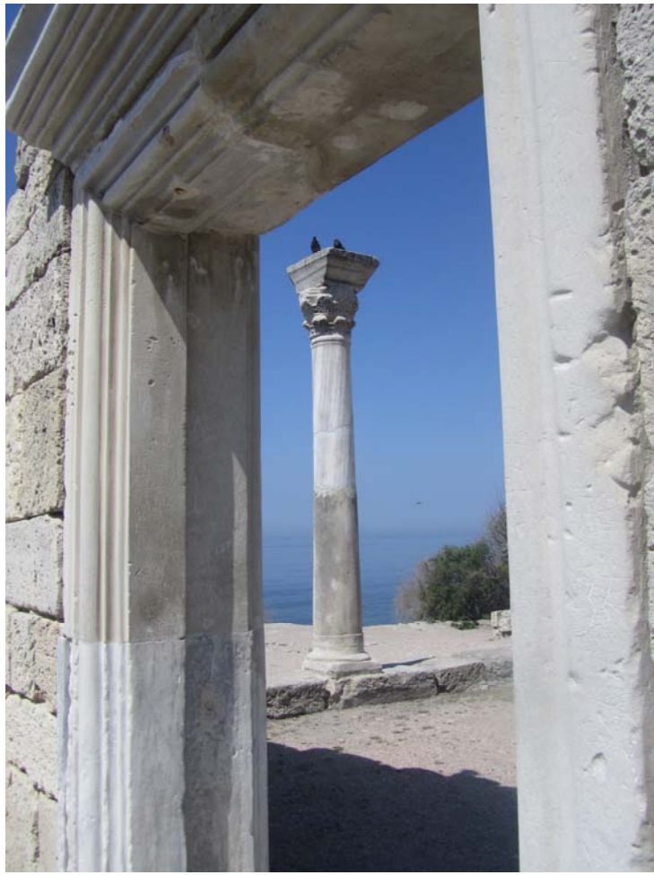
Χερσόνησος – Χερσών, πρωτοχριστιανική βασιλική. Τόσους αιώνες πλάι στο κύμα της Μαύρης Θάλασσας