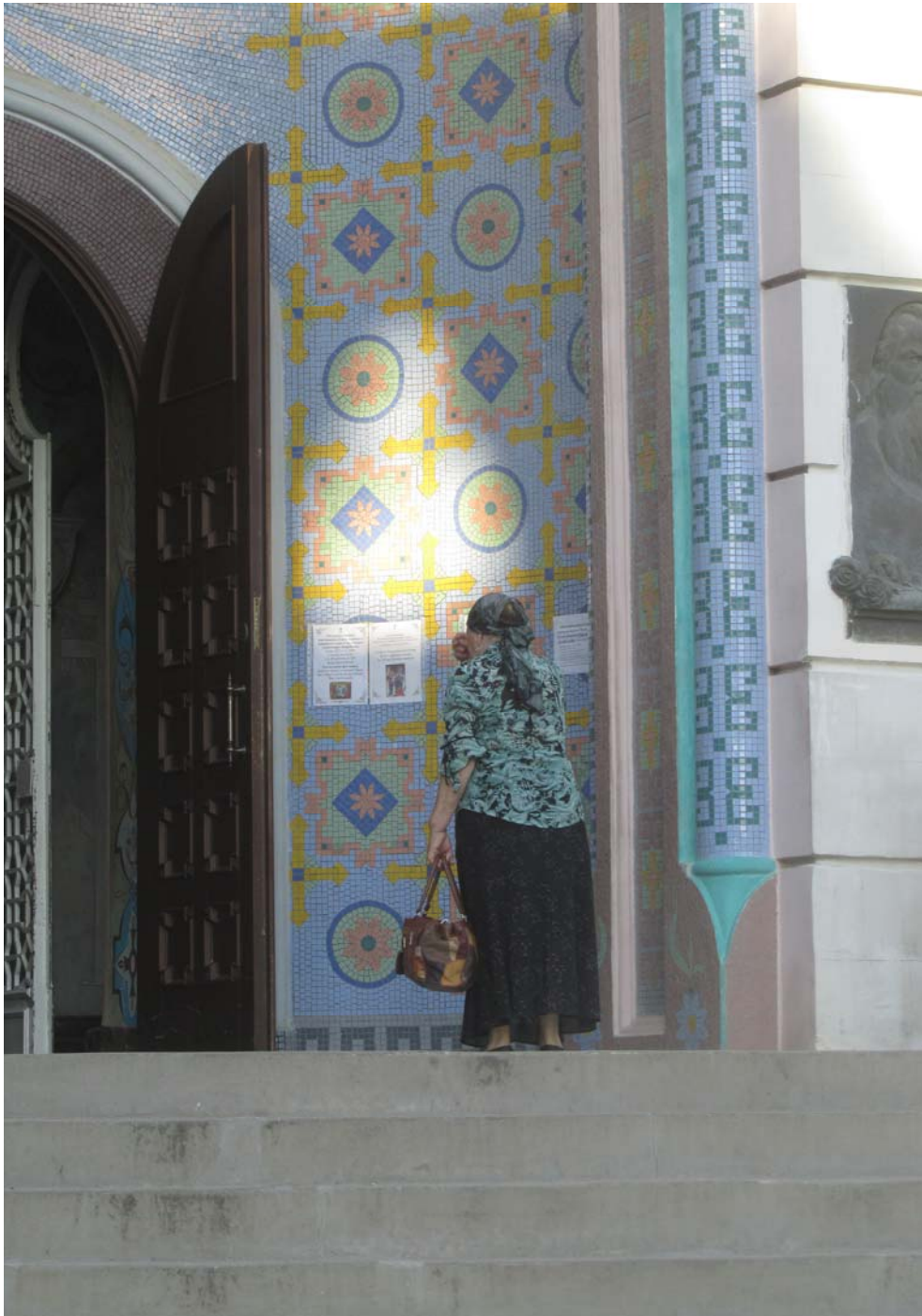
Ναός Αγίου Νικολάου, Ευπατορία. «Ευχαριστώ Αι-Νικόλα μου για την ελπίδα που ζωντάνεψες στην καρδιά μου»

Η Ευπατορία, η επονομαζόμενη «άγρια Δύση» της Κριμαίας, καθόλου άγρια δεν μου φάνηκε αφού στο πέρασμα των αιώνων έκλεισε στην αγκαλιά της και συνεχίζει να προστατεύει στοργικά τόσες εθνότητες, θρησκείες, λαούς. Αντίθετα, η ημέρα που την επισκεφθήκαμε μου φάνηκε συγκλονιστική, αφού ήταν μια μέρα επαφής με τις τρεις μονοθεϊστικές θρησκείες, που συνεχίζουν να συμβιώνουν ειρηνικά στον φιλόξενο αυτό τόπο επί αιώνες. Συμμερίζομαι την άποψη του Μαγιακόφσκι που είχε πει ότι λυπάται πολύ όσους δεν έχουν επισκεφθεί ποτέ την Ευπατορία.