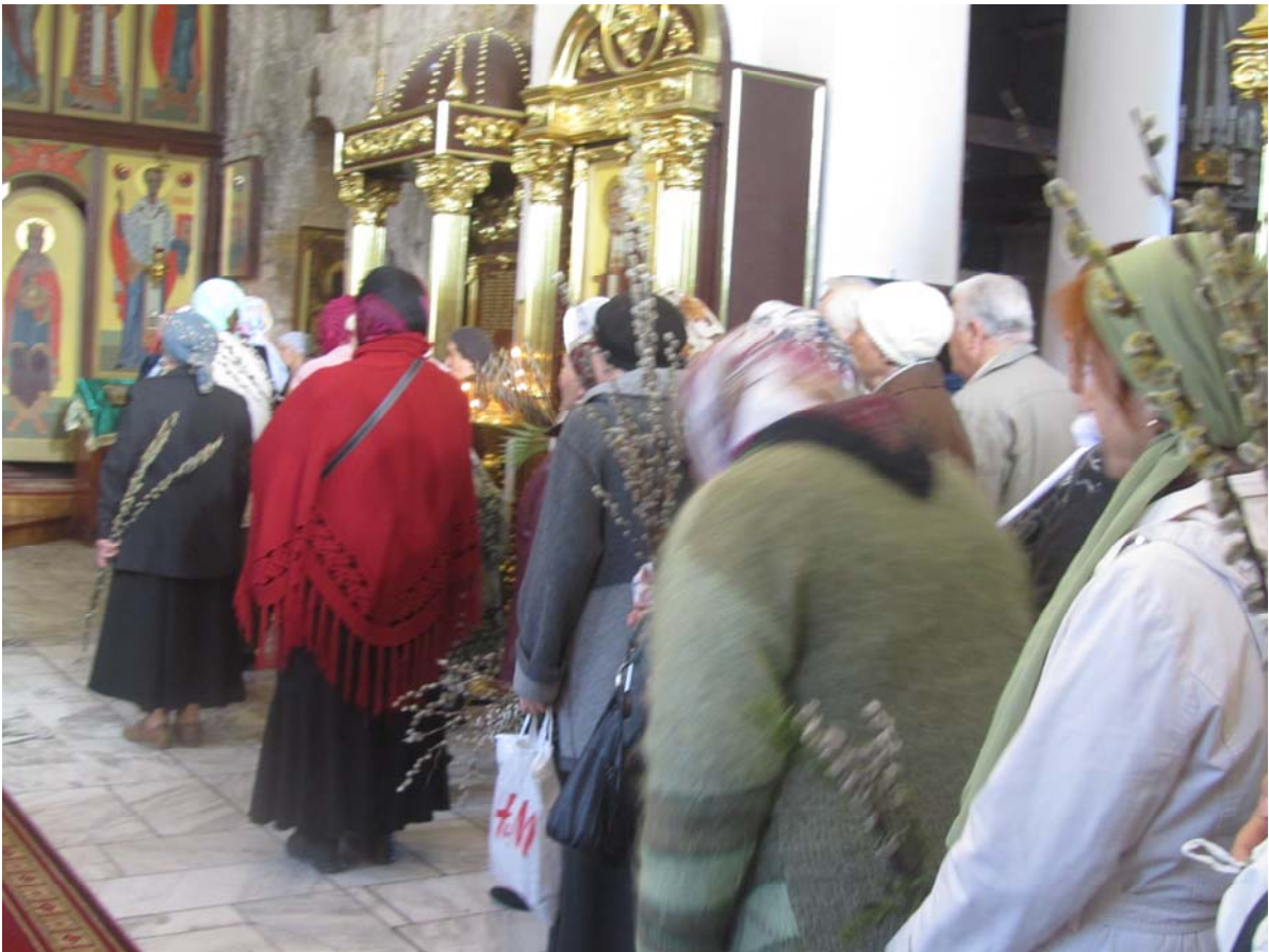
Άγιος Ιωάννης, Κερτσ. Οι ευλαβικοί πιστοί με τα δικά τους «βάγια»