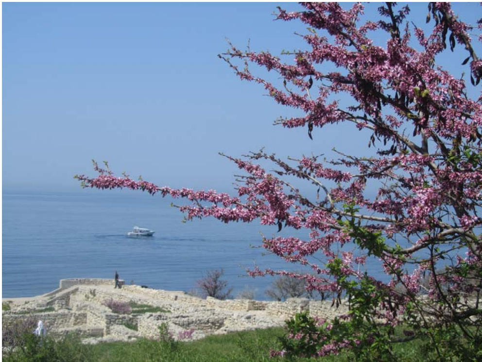
Η άνοιξη προστατεύει τα ερείπια της Χερσονήσου