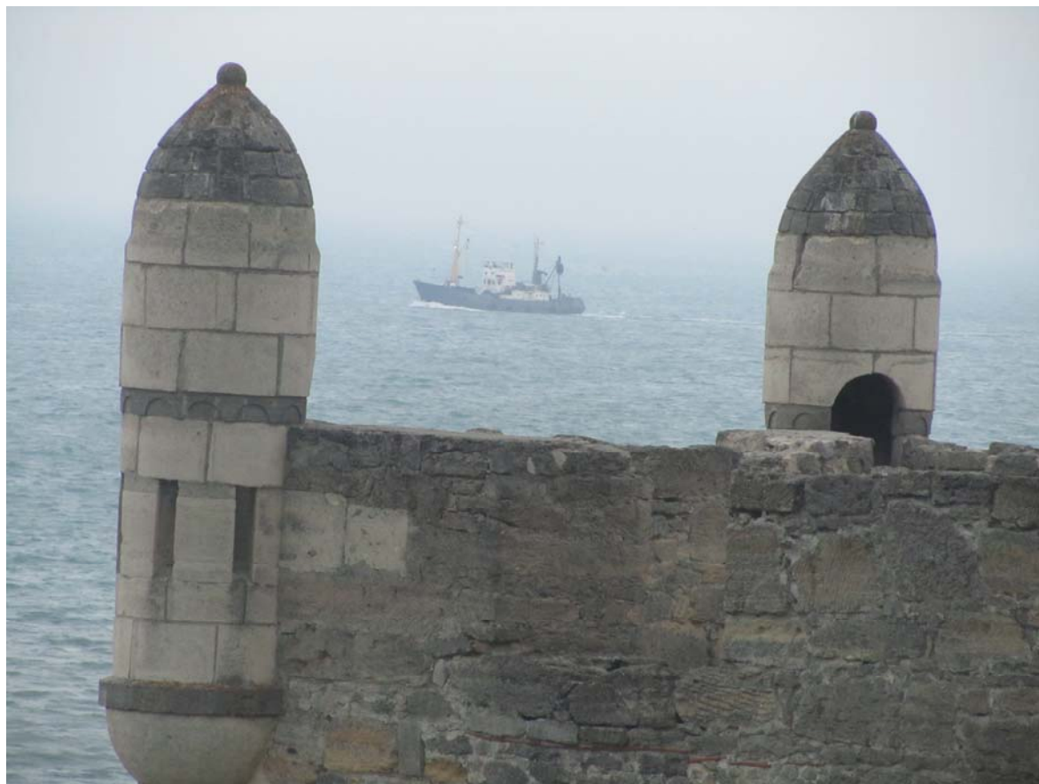
Κάστρο Γενή Καλέ, Κιμμέριος Βόσπορος. Τα ψαροκάικα βιάζονται να προλάβουν το σούρουπο

Και ξάφνου, προβάλει μέσα στο μισοσκόταδο η οπτασία του Γιάνκου Δανηλό-πουλου, του ήρωα του βιβλίου «Ευτυχισμένος που έκανε το ταξίδι του Οδυσσέα» της Μαριάννας Κορομηλά. Είναι βρεγμένος ως το κόκκαλο, έτσι που θαλασ-σοδερνόταν δυο ολόκληρα μερόνυχτα στην Αζοφική, στο απελπισμένο φευγικό του από την Μπερτιάνσκα, που σπαράσσεται από τις αντιμαχόμενες φατρίες της Οκτωβριανής Επανάστασης. Ούτε που μας πρόσεξε. Σκύβει, φιλάει το χώμα που νόμισε πως δεν θα πατήσει ξανά και χάνεται το ίδιο ξαφνικά όπως είχε εμφανιστεί.