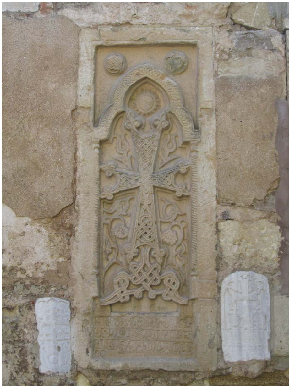
Αρμένικη εκκλησία Αγίου Σεργίου. Οι ανάγλυφοι σταυροί μοιράζονται τις παραγμένες αναμνήσεις τους

Οι αρμένικοι ανάγλυφοι σταυροί (khachkar), φερμένοι από τα πέρατα του κόσμου μαζί με τους κατατρεγμένους πιστούς τους αναπαύονται πλέον ειρηνικά στην αγκαλιά των πέτρινων τοίχων της μικρής εκκλησίας, ο ένας δίπλα στον άλλον σμίγοντας τις παραγμένες ιστορίες και τις αναμνήσεις τους.