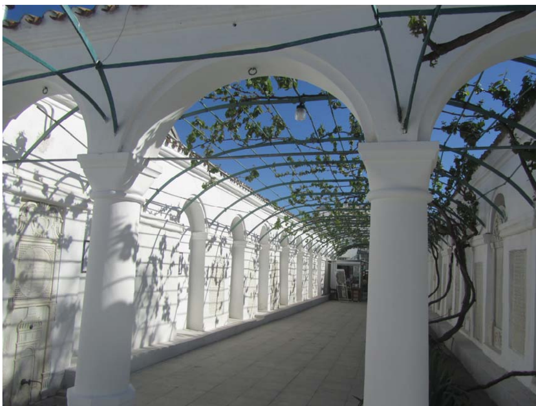
Κενάσα Καραϊτών, Ευπατορία. Το προαύλιο με την αιωνόβια άμπελο

Καραΐτες, μια, άγνωστη μέχρι τώρα σε μένα, ολιγάριθμη ομάδα ξεχωριστών Εβραίων, που ισχυρίζονται ότι είναι ο τέταρτος λαός της Βίβλου κι ακόμα ότι είναι απόγονοι των Χαζάρων και προσπαθούν πάση θυσία να διατηρήσουν την διαφορετικότητα και την αυτονομία τους. Ίσως είναι και αυτοί εκφραστές μιας γενικότερης τάσης, που παρατηρείται τα τελευταία χρόνια, όπου τονίζονται συχνά με έντονο τρόπο, οι διαφορές μεταξύ των ανθρώπων, των κρατών, των θρησκειών, μια τάση που διχάζει και δημιουργεί αντιπαλότητες.