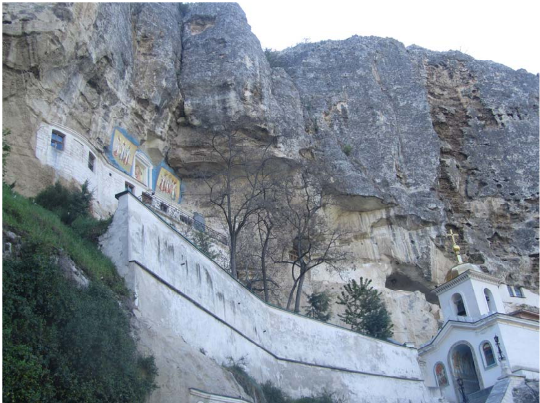
Έξω από το Μπαχτσίσεράι. Η Μονή της Παναγίας Uspenskiy κουρνιασμένη στην σχισμή του βράχου