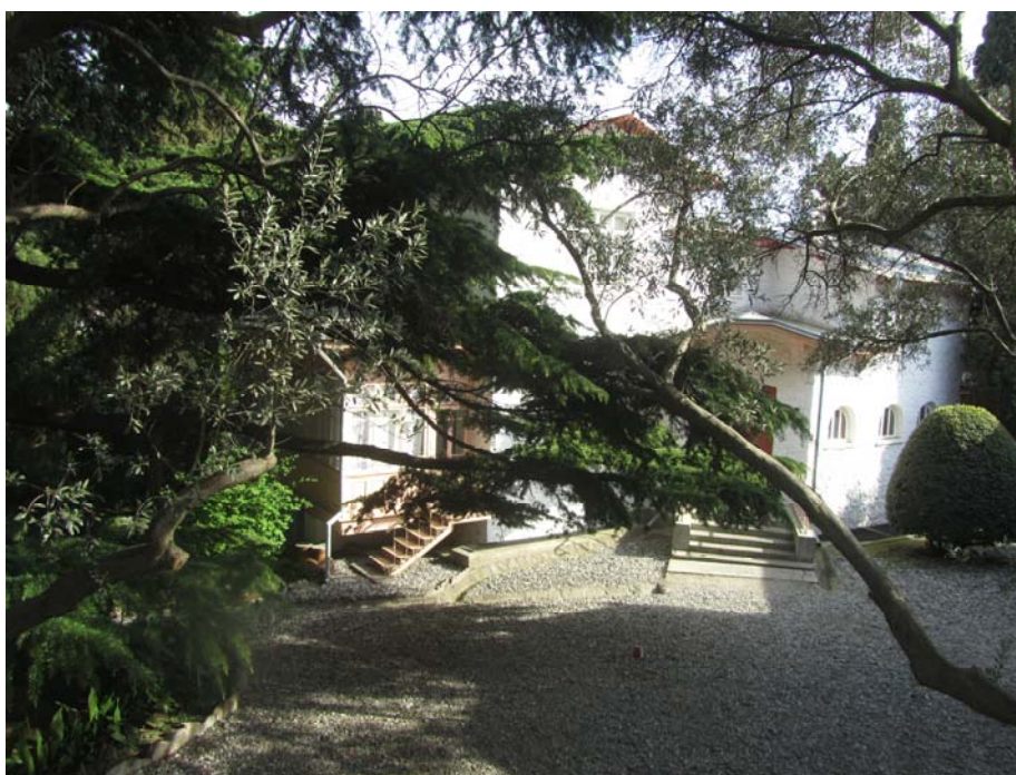
Μπελάγια Ντάτσα, το τελευταίο καταφύγιο του Αντόν Τσέχοφ

Ευτυχώς το άσπρο εξοχικό σπίτι, στα περίχωρα της Γιάλτας, που στέγασε τα τελευταία, βασανισμένα αλλά και παραγωγικά χρόνια του Αντόν Πάβλοβιτς Τσέχοφ, διατηρεί ακόμη κάτι από την αθωότητα της παλιάς Γιάλτας. Εδώ, ο Τσέχοφ δίνει τον τελευταίο αγώνα εναντίων της φυματίωσης που τον βασανίζει, με μόνα όπλα του την θέληση για δημιουργία και το γλυκό κλίμα της «ζεστής Σιβηρίας» του. Η δημιουργικότητά του αστείρευτη παρά την φθοροποιό νόσο που τον λιώνει μέρα με την μέρα. Μέσα στο κήπο του, με τις αμυγδαλιές, τις ροδακινιές και τις βυσσινιές, που καλλιεργεί συστηματικά για να τον παρηγορούν για την ζωή που φεύγει μέσα από τα χέρια του, εμπνέεται τους ήρωες των τελευταίων του έργων. «Οι τρεις αδερφές», «Η κυρία με το σκυλάκι» και «Ο βυσσινόκηπος» μόλις που πρόλαβαν να δουν το φως, πριν κλείσει για πάντα τα μάτια του ο ξεχωριστός αυτός άνθρωπος, ο σπουδαίος δραματουργός των χαμηλών τόνων με την διεισδυτική, τολμηρή ματιά, την γεμάτη όμως κατανόηση και συμπόνια.