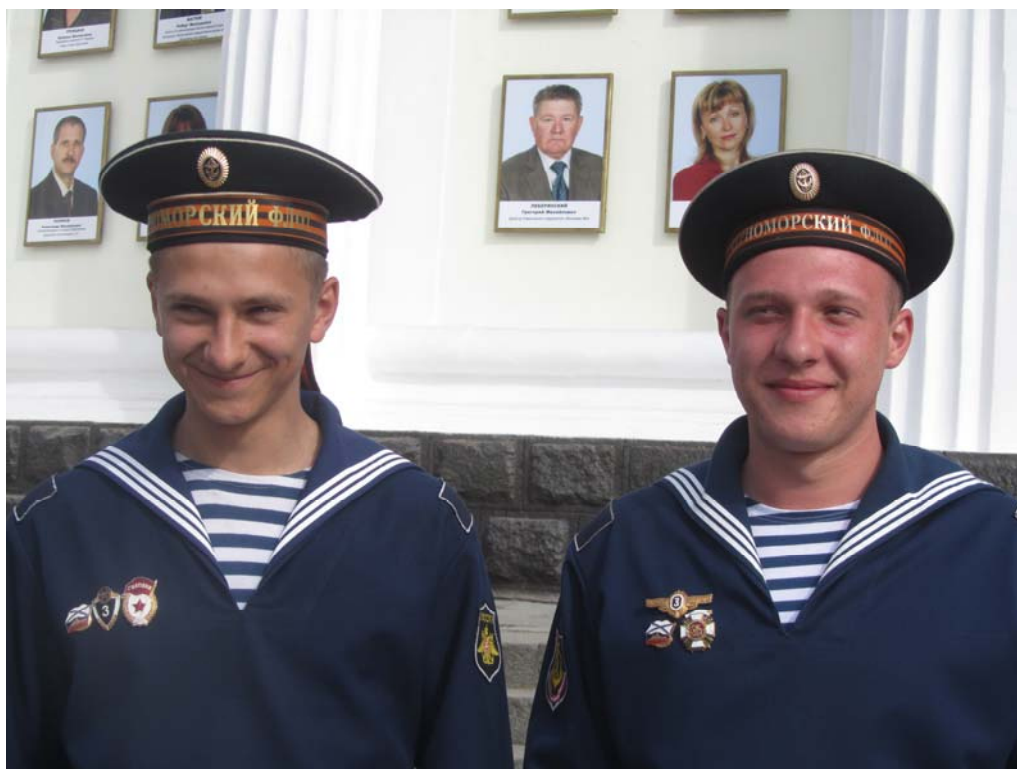
Σεβαστούπολη. Ναυτάκια μαζί με σύγχρονους «ήρωες εργασίας»