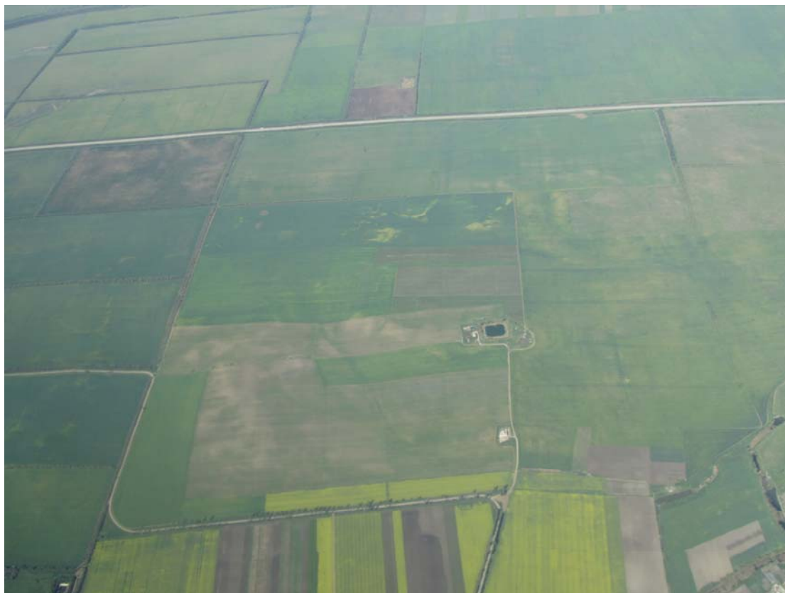
Αεροφωτογραφία. Η στέπα μας αποχαιρετά

Στην πτήση της επιστροφής από τη Συμφερόπολη για Κωνσταντινούπολη, κατακλύζουν το μυαλό μου εικόνες και σκέψεις. Σκέφτομαι τους μακράιωνους δεσμούς που συνδέουν την Ουκρανία με την Ελλάδα. Δεσμοί που ξεκινούν από την Ορθοδοξία, που μας οδηγεί να ψέλνουμε στο ίδιο βυζαντινό μέλος, έστω και με την πολυφωνική του εκδοχή στην Ουκρανία, και να κάνουμε τον σταυρό μας με τον ίδιο τρόπο. Δεσμοί που πηγάζουν από το Κυριλλικό αλφάβητο, που έχει πολλά κοινά στοιχεία με το ελληνικό, αφού σε αυτό βασίστηκε. Και ακόμη, πιο πρόσφατοι δεσμοί που οφείλονται στους χιλιάδες Ουκρανούς μετανάστες που βρήκαν, όχι πάντα φιλόξενο, καταφύγιο στην χώρα μας, για να μεγαλώσουν τα παιδιά μας και να συντροφεύσουν τους ανήμπορους γονείς μας. Μα περισσότερο νομίζω μας δένει η Μαύρη Θάλασσα, που έχει καταγραφεί στην μνήμη και των δύο λαών, σαν αιώνιος συνδετικός κρίκος.