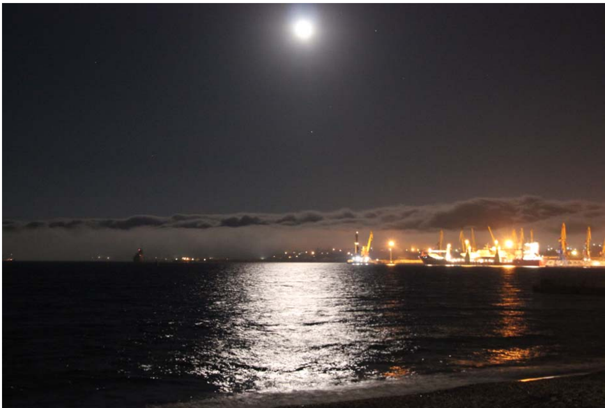
Η φεγγαράδα στη Μαύρη Θάλασσα άρχισε ήδη τις γητειές της

Πού κρύβεται άραγε αυτό το ανήμερο θεριό που έπλαθα στην φαντασία μου, το ανήλιο και σκοτεινό, το απειλητικό και ύπουλο που βασάνισε και έπνιξε στο πέρασμα των αιώνων τόσα πλεούμενα με τη μανία του για να δικαιώνει το όνομά του «Άξενος Πόντος»; Τίποτα δεν το θυμίζει απόψε. Θυμίζει μόνο τους στίχους του Ελύτη «κύματα φεύγουν έρχονται, αφρισμένη απόκριση στ' αυτιά των κοχυλιών».