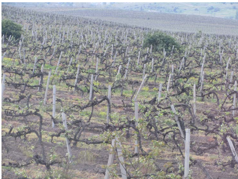
Τα ηλιοφίλητα αμπέλια της Κριμαίας

Περιήγηση στις υπόγειες στοές του οινοποιείου στη Μασσάντρα, στην πλαγιά πάνω από τη Γιάλτα, με τα σπάνια, παλαιωμένα κρασιά μέσα στα μοναδικά, χειροποίητα μπουκάλια τους, τα καλυμμένα από την σκόνη του χρόνου. Συνεχίζουν να κοιμούνται τον ευαίσθητο, δημιουργικό τους ύπνο μέχρι να τα ξυπνήσει κάποιο απαιτητικό ανθρώπινο χέρι, όπως αυτό που τα έφερε μπροστά μας για να τα δοκιμάσουμε. Κρασιά γλυκά από τα ηλιοφίλητα κλίματα της Κριμαίας. Με τα αρώματα του κερασιού, του ροδάκινου, του δαμάσκηνου, της κανέλας, ευφραίνουν τον ουρανίσκο, ευφραίνουν τις καρδιές μας. Φέρνουν στο νου το κείμενο του Μαξίμ Γκόρκι: «Το πιο σημαντικό συστατικό του κρασιού είναι ο ήλιος. Να ζήσουν οι άνθρωποι που γνωρίζουν πώς να φτιάχνουν το κρασί και με αυτό να μεταφέρουν την δύναμη του ήλιου στις ψυχές των ανθρώπων». «Οίνος ευφραίνει καρδιάν ανθρώπου» όπως λένε και οι ψαλμοί του Δαβίδ και όπως πίστευαν οι αρχαίοι μας πρόγονοι. Είναι εκείνοι που πρώτοι έφεραν την καλλιέργεια του αμπελιού στην αρχαία Ταυρική. Και μόνον αυτό να είχαν κάνει, θα ήταν αρκετό για να τους θυμούνται και να τους ευγνωμονούν οι σημερινοί κάτοικοι της Κριμαίας.