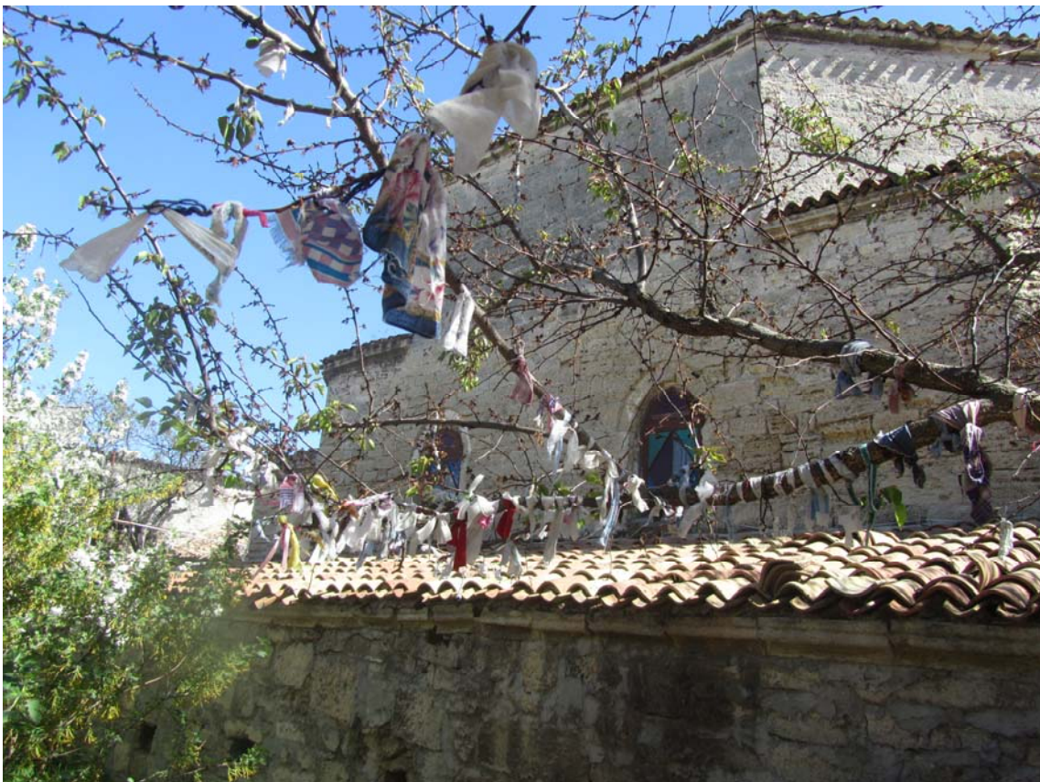
Τεκές δερβίσηδων, Ευπατορία. Κουρελάκια δεμένα στα κλαδιά, απεγνωσμένη προσπάθεια επικοινωνίας με τον Θεό

Κουρελάκια δεμένα στα κλαδιά του δέντρου έξω από τον Τεκέ των δερβίσηδων, η απεγνωσμένη προσπάθεια του ανθρώπου να επικοινωνήσει με τον Θεό. Με την είσοδό μας στο ιστορικό μνημείο, άρχισε η προσπάθεια κατανόησης του τρόπου με τον οποίο οι περιστρεφόμενοι δερβίσηδες (του τάγματος των Μεβλεβί) προσπαθούν να προσεγγίσουν το άγνωστο, το θείο, επιστρατεύοντας όλες τους τις δυνάμεις, σωματικές και ψυχικές. Έκλεισα τα μάτια και εκεί που δεν το περίμενα, ο μαυλιστικός ήχος του ζουρνά με ξέκοψε από το, για πολλούς, τουριστικό περιβάλλον και μου δημιούργησε μια βαθειά, απρόσμενη συγκίνηση. Ίσως ήμουν ήδη ευαισθητοποιημένη και δεκτική από το προσκύνημα στον Άγιο Λουκά που είχε προηγηθεί.