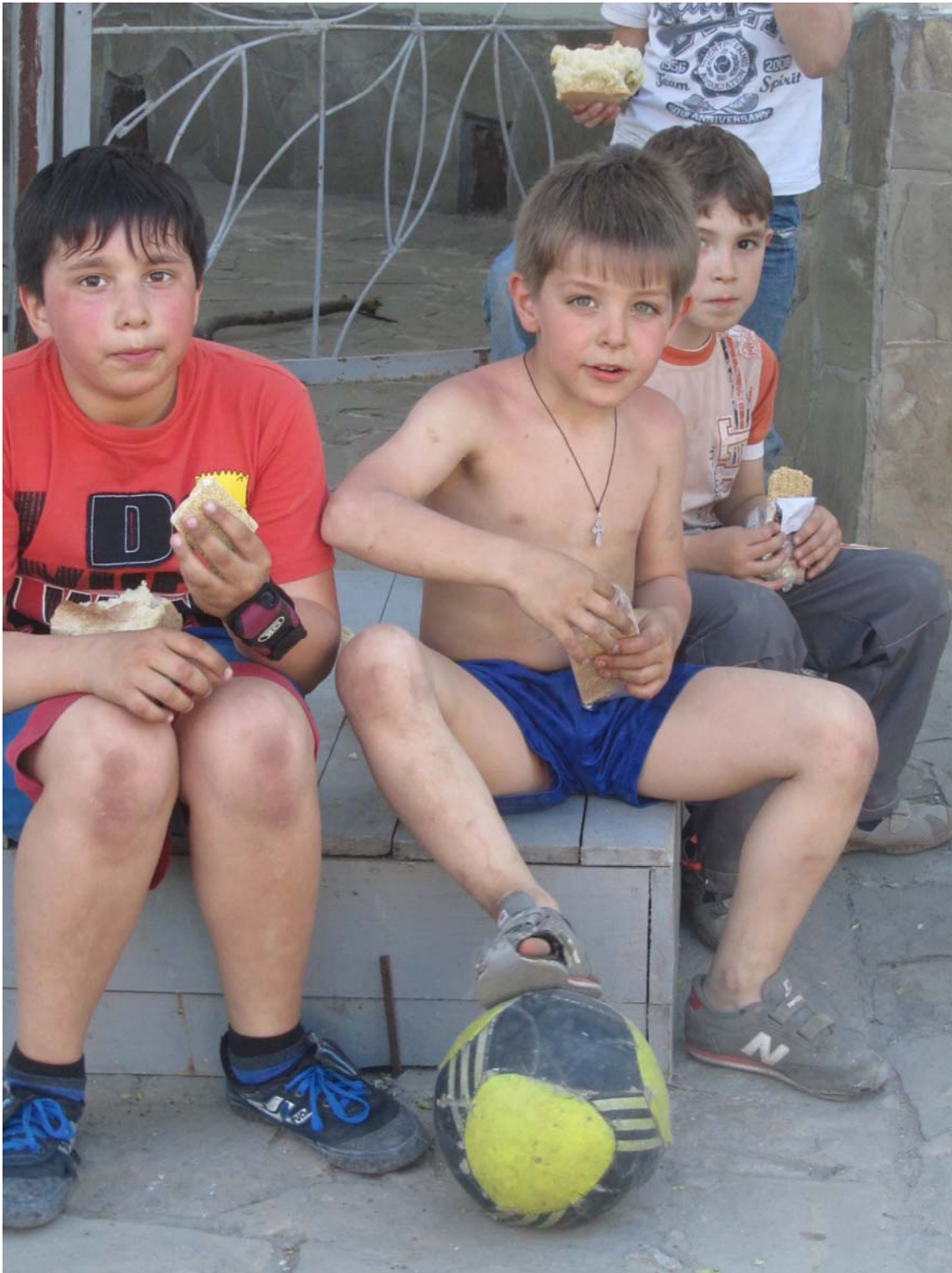
Ευπατορία. «Παιδί με το γρατσουνισμένο γόνατο»