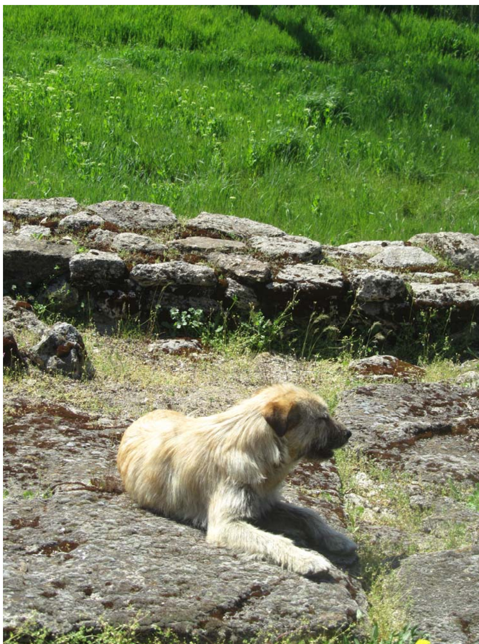
Ακούγοντας υπομονετικά την ξενάγηση στην αρχαία Τιριτάκη

Οι πρωτόγονες πέτρινες άγκυρες στον αρχαιολογικό χώρο αυτής της ελληνικής αποικίας, φέρνουν στο μυαλό τις άγκυρες των Αργοναυτών. Εκείνες που άλλαζαν σε συνεχώς ελαφρότερες στο μυθικό ταξίδι τους προς την Κολχίδα, αφιερώνοντας τις προηγούμενες στα ιερά που συναντούσαν σαν ευχαριστία και παράκληση ταυτόχρονα για ακύμαντο ταξίδι.