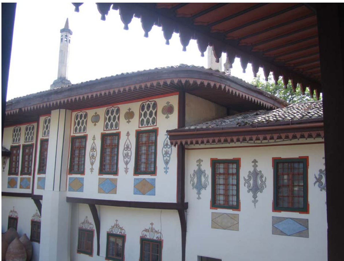
Μπαχτσίσεράι. Το παλάτι των Χαν μεταφέρει την αίσθηση της Ανατολής στην Κριμαία

Φθάνοντας στο Μπαχτσησεράι, βορειοανατολικά της Σεβαστούπολης, μεταφερθήκαμε ξαφνικά στην Ανατολή. Το παλάτι των Χαν του μεσαιωνικού, Ταταρικού Χανάτου της Κριμαίας, με τα χαγιάτια του, τα ξυλόγλυπτα ταβάνια, τα χρωματιστά του τζαμιλίκια, τις λαϊκές ζωγραφιές στους εξωτερικούς του τοίχους, τις περίτεχνες κρήνες και την γαλήνη των παραδεισένιων κήπων του, μας μετέφερε σε μια άλλη εποχή, σε μια άλλη κουλτούρα: της χλιδής, του αισθησιασμού αλλά και της μυστικοπάθειας. Βγαίνοντας από την πόλη, το τοπίο γίνεται ιδιαίτερα εντυπωσιακό. Άσπρα, ασβεστολιθικά, απότομα βράχια σχηματίζουν τεράστια, κατακόρυφα παραπετάσματα, διάτρητα από κοιλάματα και σπηλιές. Η Καππαδοκία στην Κριμαία! Μόνο που εδώ, στα τεράστια κοιλάματα των βράχων δεν στεγάζονται αποκλειστικά χριστιανικές εκκλησίες και μοναστήρια, όπως η Μονή της Κοιμήσεως της Θεοτόκου (Uspenskiy) που θυμίζει έντονα την Παναγία την Σουμελά του Πόντου. Υπάρχουν και ολόκληρες υπόσκαφες πολιτείες, όπως το Τσουφούτ Καλέ (Chufut Kale) όπου ζούσαν οι (αιρετικοί) Καραΐτες Εβραίοι για να διάγουν τον βίο τους σύμφωνα με τις δικές τους συνήθειες και, ταυτόχρονα, να βρίσκονται κοντά στην ταταρική πρωτεύουσα για να ασκούν το εμπόριο και τις τέχνες.