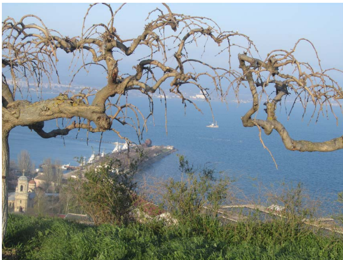
Θέα από τον λόφο του Μιθριδάτη στο Κερτς. Οι «κινέζικοι δράκοι» άδικα απειλούν την ηρεμία του τοπίου

Στην κορυφή του λόφου όπου ήταν η ακρόπολη του αρχαίου Παντικάπαιου, υψώνεται σήμερα ένας οβελίσκος, μνημείο για τους πεσόντες του Β΄ Παγκοσμίου Πολέμου. Έχει χτιστεί με τις πέτρες ενός άλλου μνημείου, της εκκλησίας της Αγίας Τριάδας όπου βαπτίστηκε ο Άγιος Λουκάς, που έστεκε στην ίδια θέση επί χρόνια και κατεδαφίστηκε επί Στάλιν. Για άλλη μια φορά η μισαλλοδοξία που χτίζει γκρεμίζοντας. Γύρω-γύρω η καταγραφή των ηρωικών πόλεων της Σοβιετικής Ένωσης του Μεγάλου Πατριωτικού Πολέμου: Λένινγκραντ, Στάλινγκραντ, Σεβαστούπολη, Κέρτς... Εκατοντάδες χιλιάδες κορμιά που έπεσαν λιγότερο ή περισσότερο ηρωικά, «συμπυκνωμένα» σε μια μικρή χαραγμένη πλάκα με το όνομα του τόπου του μαρτυρίου τους.