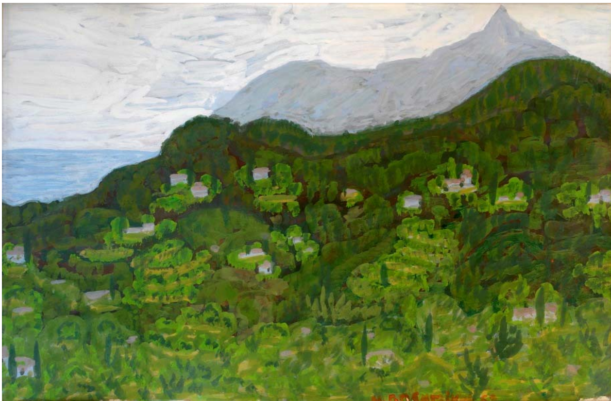
Ο Άθως από τη Μονή Κουτλουμουσίου, 1952, τέμπερα σε χαρτόνι, 28,3 x 43,5 εκ.

Συλλογή Γιώργου Κωστόπουλου, με την ευγενική μεσολάβηση των Kalfayan Galleries Αθήνα – Θεσσαλονίκη