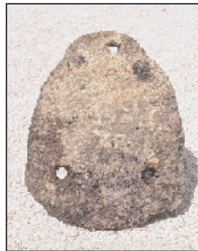
Η λίθινη άγκυρα που ανελκυστηκε από το ναυάγιο Ιρίων και που πιθανότατα ανήκε στο κυπρομικηναϊκό πλοίο.

Στους ίδιους χώρους του Μουσείου Σπετσών συντηρήθηκαν και φυλάσσονται τα ευρήματα από το φορτίο του δεύτερου προϊστορικού ναυαγίου που ερευνήθηκε συστηματικά επίσης από το Ι.Ε.Ν.Α.Ε.: του κυπρομικηναϊκού ναυαγίου του Ακρωτηρίου Ιρίων 3 . Η συστηματική του έρευνα ξεκίνησε το 1991 υπό τη διεύθυνση του αρχαιολόγου Χαράλαμπου Πέννα. Η ομάδα του Ινστιτούτου, από το