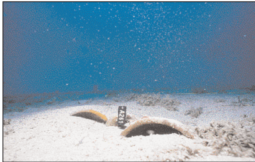
Η παραμονή των ευρημάτων του ναυαγίου του Δοκού επί 4.200 χρόνια μέσα στη θάλασσα, επέβαλε τη μεταφορά τους, για συντήρηση και φύλαξη, στον πλησιέστερο καταλληλότερο χώρο: στο Κρατικό Μουσείο Σπετσών. Εκεί οργανώθηκε και εξοπλήστηκε σύγχρονο εργαστήριο αφαλάτωσης και συντήρησης, κατά τη σταδιακή ανέλυσή τους από το βυθό.

Η εποχή των συστηματικών ερευνών με εξειδικευμένο προσωπικό και σύγχρονα μέσα ξεκινά το 1989 με την ανασκαφή στο ναυάγιο του Δοκού 2 . Στα 4 χρόνια που ακολουθούν περισσότεροι από 100 αρχαιολόγοι, τεχνικοί και δύτες, μέλη της ερευνητικής ομάδας του Ι.Ε.Ν.Α.Ε. υπό τη διεύθυνση του Γ. Παπαθανασόπουλου ανελκύουν χιλιάδες αγγεία ή τμήματά τους, μυλόλιθους και τριπηρές καθώς και δύο λίθινες άγκυρες. Όλα τα ευρήματα μεταφέρονται για συντήρηση και φύλαξη στο πλησιέστερο κρατικό μουσείο, στο Μουσείο Σπετσών. Χιλιάδες ευρήματα μεταφέρονται με πλωτά μέσα από το χώρο της ανασκαφής στο μουσείο. Τα χαρακτηριστικά και οι διαστάσεις κάθε ευρήματος καταγράφονται πριν αρχίσει η διαδικασία αφαλάτωσης και καθαρισμού τους. Ο φιλόξενος χώρος του Μουσείου Σπετσών αλλά κυρίως η αφοσίωση και η υποστήριξη του προσωπικού