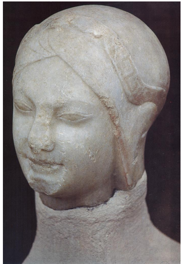
Από τον ναό της Αθηνάς στην αρχαϊκή Σμύρνη, το νεότερο Μπαϊρακλί στον μυχό του κόλπου της Σμύρνης, 550 π.Χ.