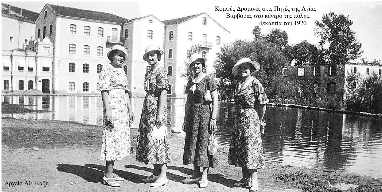
Κομπές Δραμινές στις Πηγές της Αγίας Βαρβάρας στο κέντρο της πόλης, δεκαετία του 1920