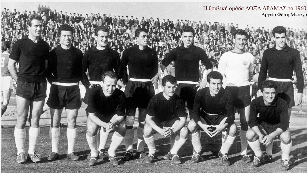
Η θρυλική ομάδα ΔΟΞΑ ΔΡΑΜΑΣ το 1960

Η «βαριά βιομηχανία» της Δράμας του 1930: Παραγωγή αεριούχων ποτών (μ' άλλα λόγια γκαζόζες), διαβάζουμε στη λεζάντα, αλλά η πραγματικότητα είναι ότι η Δράμα του Μεσοπολέμου είχε και βαριά βιομηχανία, την οποία μας θυμίζουν οι φωτογραφίες των καπναποθηκών στο κέντρο, μάλιστα, της πόλης (όπως αυτή του Αναστασιάδη και η πρώτη που συμπεριλάβαμε εδώ). Οι καπναποθήκες ή καπνομάγαζα, κτήρια επεξεργασίας του καπνού, βρίσκονταν στις Πηγές της Αγίας Βαρβάρας, επειδή τα νερά του γραφικού κέντρου της πόλης εξασφάλιζαν την απαιτούμενη υγρασία και θερμοκρασία για τη συντήρηση του καπνού.