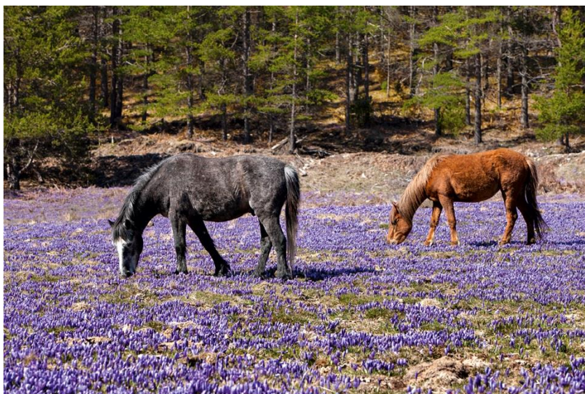
Άγρια άλογα στο οροπέδιο Σίτνα στο Φαλακρό (αριστερά) και στο Δάσος Ελατιάς (δεξιά).