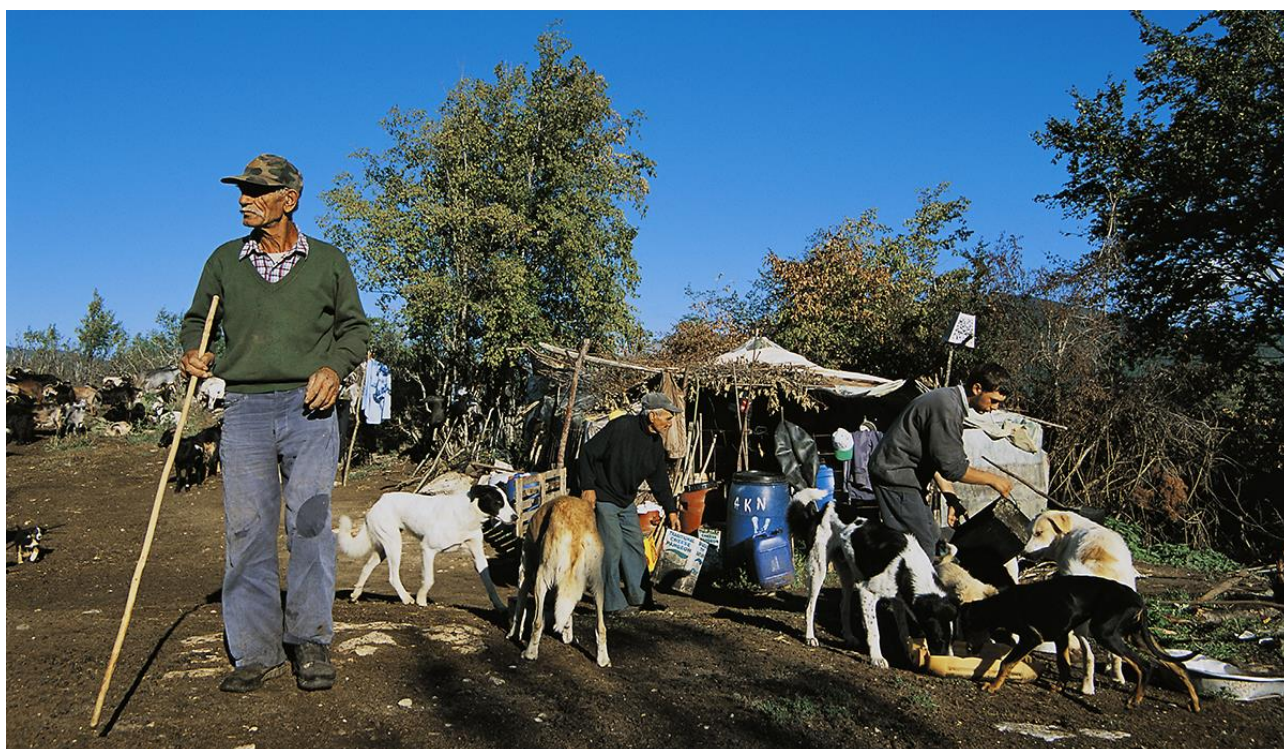
Στα ορεινά της Κάτω Βροντούς: Τάισμα σκύλων σε μαντρί υπό την επιτήρηση του τσέλιγκα. Τα κτηνοτροφικά προϊόντα της Δράμας είναι εξαιρετικά, τα δε καπνιστά της εκλεκτότατα.

Ασφαλώς οι εικόνες δεν απευθύνονται παρά μόνο στην όραση και δεν εξαντλούν την αισθητική απόλαυση που μπορεί να αποκομίσει κανείς από την άμεση επαφή με τον τόπο, την ιστορία του, τους ανθρώπους του, τη φύση, τα ζώα και τα φυτά του. Μπορούν ωστόσο να λειτουργήσουν ως μία εξαιρετική πρώτη γνωριμία με μια απροσδόκητα πανέμορφη περιοχή που, παρά τις προνομιακές της ιδιαιτερότητες, έχει μείνει έξω από τις στοχεύσεις της επίσημης στρατηγικής τουριστικής προβολής και αξιοποίησης. Και όμως η Δράμα –πόλη και νομός– έχει τεράστια, αν και εν πολλοίς άγνωστη, συμβολή στην ιστορία, τον πολιτισμό, την οικονομία, τον αθλητισμό και τον οικολογικό πλούτο της Ελλάδας. Είναι τόπος που η προσέγγισή του προϋποθέτει γνώση, σεβασμό και αγάπη για κάτι που είναι διαχρονικά ωραίο και αυθεντικό και ως εμπειρία απολαυστικό και αλησμόνητο. Οι εικόνες, δίνουν απλώς μια ιδέα!