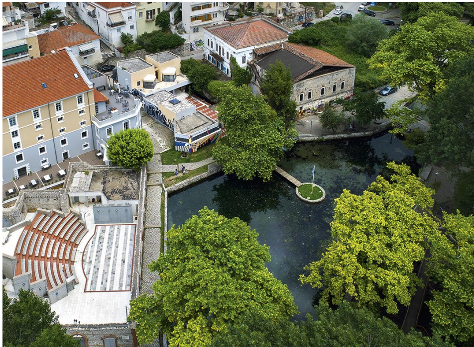
Το βορειοανατολικό τμήμα του Πάρκου της Αγίας Βαρβάρας. Αγριόκουρκος.

Το Λεύκωμα και η Έκθεση είναι μια ευκαιρία να γνωρίσουμε τη Δράμα μέσα από εικόνες και κείμενα. Το Πανόραμα στηρίζει με ενθουσιασμό τις πολιτιστικές και περιβαλλοντικές πρωτοβουλίες της νεοσύστατης Εταιρείας ΚΥΚΛΩΨ και προτείνει σε μέλη και φίλους να γνωρίσουν και την ίδια τη Δράμα. Οι διακοπές των Χριστουγέννων είναι ιδανική περίοδος για τους χιονολάτρες (Χιονοδρομικό Κέντρο Φαλακρού), αλλά και τους πεζοπόρους και τους φυσιολάτρες και όσους θέλουν να γνωρίσουν από κοντά το Πελίτι (μεγάλη μονάδα βιολογικής γεωργίας και πολλών εναλλακτικών δραστηριοτήτων) ή να απολαύσουν ξέγνοιαστες μέρες σε έναν ήρεμο τόπο με πολλές διαφυγές (όπως τα Τέμπη του Νέστου) και καλά εστιατόρια με τοπική κουζίνα. Ακόμα λιώνει στο στόμα μας εκείνο το κατσικάκι με πατάτες στον φούρνο που είχαμε φάει στους Πύργους (;) πριν από χρόνια. Η μνήμη της γεύσης είναι απίστευτα ισχυρή. Μια βόλτα στο τοπικό Αρχαιολογικό Μουσείο κι άλλη μία περιήγηση στους Φιλίππους και στο Αρχαιολογικό της Καβάλας. Βάλτε τη Δράμα και τα βουνά της στο χριστουγεννιάτικο ή το ανοιξιάτικο πρόγραμμά σας.