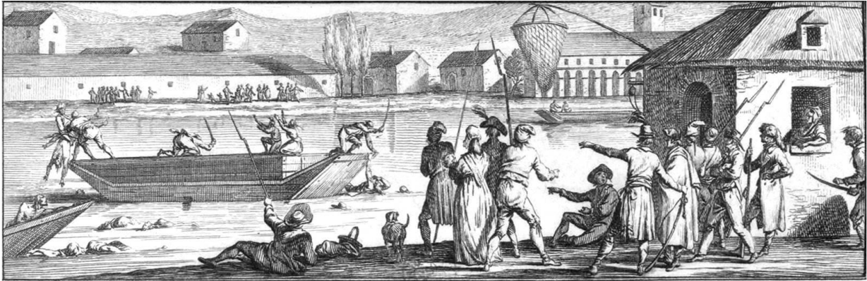
Σε αυτή την στάμπα του 1798 απεικονίζονται οι πνιγμοί των αντεπαναστατών στην περίοδο της Τρομοκρατίας στη Νάντη. Εθνική Βιβλιοθήκη της Γαλλίας, Παρίσι

Δ) ΣΥΜΒΑΤΙΚΗ ΣΥΝΕΛΕΥΣΗ (Convention) : Μετά την πτώση της μοναρχίας, η Συμβατική ανέλαβε να συντάξει νέο σύνταγμα, το δεύτερο κατά σειρά της Επανάστασης, το Σύνταγμα της Δημοκρατίας. Την συντηρητική παράταξη αποτελούσαν τώρα οι Γιρονδίνι (το όνομά τους, Girondins , προήλθε από έναν νόμο που ψηφίστηκε στην πόλη Gironde). Το κέντρο, όπως και στην προηγούμενη Νομοθετική, το συγκροτούσαν οι «Πεδινοί», άχρωμοι και άοσμοι, που τελικά κλίνανε υπέρ των Ιακωβίνων. Την προοδευτική «αριστερή» παράταξη αντιπροσώπευαν τώρα οι Ιακωβίνοι, οι λεγόμενοι «Ορεινοί». Στις μέρες της Συμβατικής θα ξεσπάσει η Τρομοκρατία ( La Terreur ) και η Επανάσταση θα βιώσει τις πιο σκληρές στιγμές της. Ουσιαστικά η Επανάσταση θα κορυφωθεί κατά την διάρκεια της Συμβατικής. Τυπικά, όμως, συνεχίζεται και κατά την διάρκεια του καθεστώτος που θα διαδεχθεί την Συμβατική, το 1795, με το όνομα «Θερμιδώρ» ή «Θερμιδώρ» (από τον θερμό μήνα Ιούλιο του Επαναστατικού Ημερολογίου). Τυπικά, η Επανάσταση τελειώνει με ρητή δήλωση του Ναπολέοντα Βοναπάρτη κατά την περίοδο της Υπατείας που διαδέχεται την Θερμιδοριανή περίοδο.