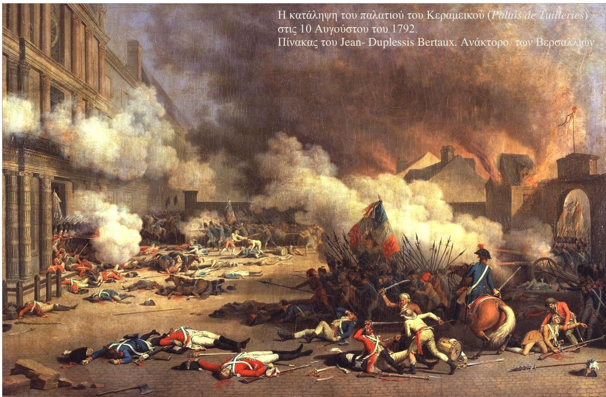
Η κατάληψη του παλατιού του Κεραμεικού ( Palais de Tuilleries ) στις 10 Αυγούστου του 1792. Πίνακας του Jean- Duplessis Bertaux. Ανάκτορο των Βερσαλλιών

ΟΙ ΕΠΙΤΡΟΠΕΣ. Για την διαχείριση πρακτικών ζητημάτων εκτελεστικής εξουσίας, ιδρύθηκαν πολλές επιτροπές. Οι Επιτροπές απαρτίζονταν από μέλη διορισμένα τυπικά από την Συμβατική Συνέλευση, ουσιαστικά όμως τους διορισμούς τους υπαγόρευαν οι Λέσχες. Οι κυριότερες Επιτροπές ήταν: η Επιτροπή Δημόσιας Ασφαλείας (με αστυνομικά καθήκοντα) και η Επιτροπή Κοινής Σωτηρίας (η οποία στην αρχή είχε καθήκοντα επιτήρησης της Επανάστασης στις επαρχίες, κατέληξε όμως να είναι η ουσιαστική κυβέρνηση και η κινητήρια δύναμη της Επανάστασης και η πηγή της Τρομοκρατίας). Μέλη της Επιτροπής Κοινής Σωτηρίας χρημάτισαν και οι τρεις μεγάλοι Άνδρες της Επανάστασης, ο Νταντόν, ο Μαρά και ο Ροβεσπιέρος.