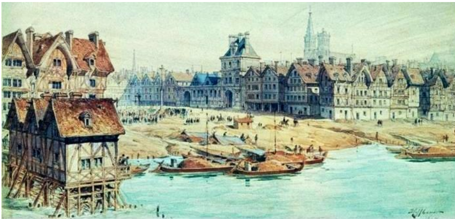
Το Hôtel de Ville (το Δημαρχείο του Παρισιού) ήταν η έδρα της Κομμούνας.

Πίνακας του Théodore-Joseph Hoffbauer, 1839.