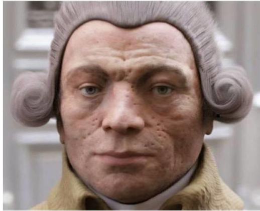
Απεικόνιση της μορφής του Ροβεσπιέρου από τον Φίλιπ Ρες, ειδικό στην τρισδιάστατη ανασύνθεση προσώπων.

πλευρά της). Τάχθηκε υπέρ της θανάτωσης του βασιλιά και υπέρ της προγραφής των Γιρονδίνων, διαδραματίζοντας σημαντικό ρόλο στην εξολόθρευσή τους. Με την εκλογή του στην Επιτροπή Κοινής Σωτηρίας τον Ιούλιο του 1793 θεωρήθηκε ο ηθικός ηγέτης της Επανάστασης, υπεύθυνος για την καρατόμηση των Εμπειριστών και των Νταντοντιστών, καθώς και ο κυριότερος εμπνευστής και βασικός ηγέτης της Τρομοκρατίας. Αδιάλλακτος δογματικός, ανίκανος να χειριστεί τις αμφισημίες της πολιτικής, εξώθησε την Τρομοκρατία στα άκρα και προκάλεσε εύλογα μία συνασπισμένη αντίδραση εναντίον του, που οδήγησε στην σύλληψη και τον θάνατο του στο ικρίωμα, γεγονότα που σήμαναν το καταλάγιασμα και βαθμιαία το τέλος της Τρομοκρατίας, εγκαινιάζοντας έτσι την Θερμιδοριανή περίοδο στην ιστορία της Επανάστασης.