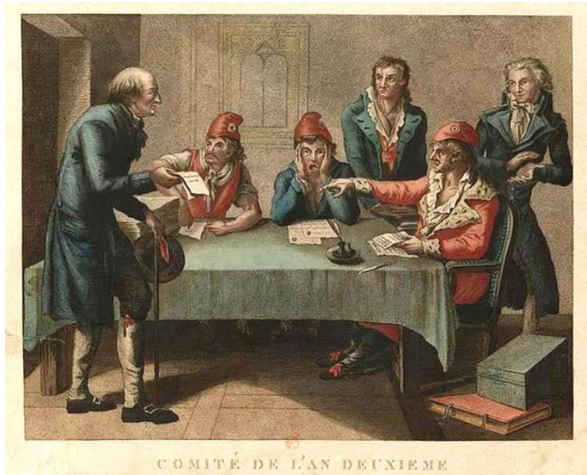
Μια επιτροπή ελέγχου παρέχει πιστοποιητικό κοινωνικών φρονημάτων. Στάμπα, 1793. Εθνική Βιβλιοθήκη της Γαλλίας, Παρίσι

ΟΙ ΕΠΙΤΡΟΠΕΣ. Για την διαχείριση πρακτικών ζητημάτων εκτελεστικής εξουσίας, ιδρύθηκαν πολλές επιτροπές. Οι Επιτροπές απαρτίζονταν από μέλη διορισμένα τυπικά από την Συμβατική Συνέλευση, ουσιαστικά όμως τους διορισμούς τους υπαγόρευαν οι Λέσχες. Οι κυριότερες Επιτροπές ήταν: η Επιτροπή Δημόσιας Ασφαλείας (με αστυνομικά καθήκοντα) και η Επιτροπή Κοινής Σωτηρίας (η οποία στην αρχή είχε καθήκοντα επιτήρησης της Επανάστασης στις επαρχίες, κατέληξε όμως να είναι η ουσιαστική κυβέρνηση και η κινητήρια δύναμη της Επανάστασης και η πηγή της Τρομοκρατίας). Μέλη της Επιτροπής Κοινής Σωτηρίας χρημάτισαν και οι τρεις μεγάλοι Άνδρες της Επανάστασης, ο Νταντόν, ο Μαρά και ο Ροβεσπιέρος.