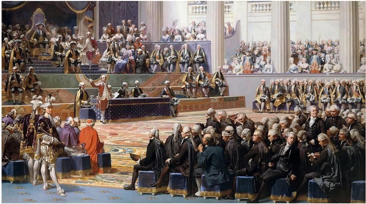
Η σύγκληση των Τριών Τάξεων στις Βερσαλλίες, 5 Μαΐου 1789. Πίνακας του Auguste Coudeur, 1839. Μουσείο της Ιστορίας της Γαλλίας, Βερσαλλίες

Α) ΕΘΝΟΣΥΝΕΛΕΥΣΗ ( Assemblée nationale ): Τον Ιούνιο του 1789, ο βασιλιάς Λουδοβίκος ΙΣΤ΄ συγκάλεσε τις τρεις τάξεις του βασιλείου (τον Κλήρο, τους Ευγενείς και την Τρίτη Τάξη –δηλαδή τους Αστούς) στις Βερσαλλίες, προκειμένου να αποφασιστούν οικονομικές και φορολογικές μεταρρυθμίσεις. Οι αντιπρόσωποι της Τρίτης Τάξης, θεωρώντας ότι εκπροσωπούν το συντριπτικά μεγαλύτερο μέρος του γαλλικού λαού, περίπου το 96%, αποφάσισαν να ανακηρύξουν την συνέλευσή τους «Συνέλευση των Αντιπροσώπων του Γαλλικού Λαού» ή «Εθνοσυνέλευση». Στην Εθνοσυνέλευση αυτή προσχώρησαν αργότερα και οι άλλες δύο τάξεις, ο Κλήρος και οι Ευγενείς. Λίγο αργότερα, προκειμένου να ψηφίσει σύνταγμα για την Γαλλία, η Εθνοσυνέλευση αυτοανακηρύχθηκε Συντακτική Συνέλευση.