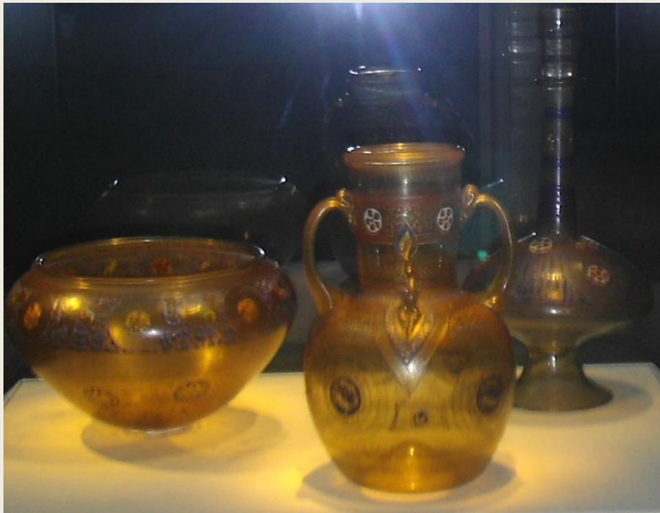
«Ο θησαυρός της Υεμένης». Τρία αντικείμενα από φυσικό γυαλί κατασκευασμένα στη Συρία την εποχή των Μαμελούκων, για να πάνε στον σουλτάνο της Υεμένης, αλλά κατέληξαν στην Κίνα. Χρονολογούνται μεταξύ 1325 και 1340. Γκαλερί Free and Sackler, Ουάσιγκτον