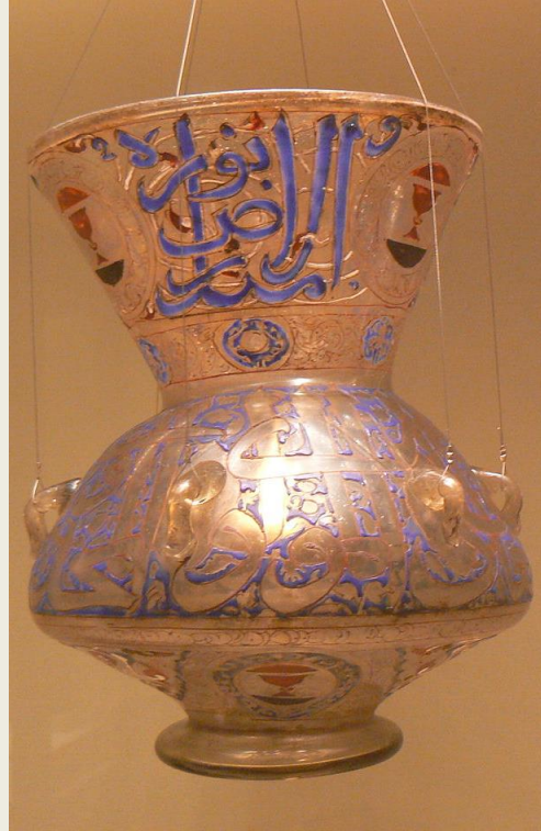
Γυάλινη καράφα, 12ος αι., και γυάλινη καντήλα με σμαλτωμένη επιγραφή και διακοσμήσεις από τη μεσαιωνική Περσία (Ιράν). Μουσείο του Λούβρου, Παρίσι