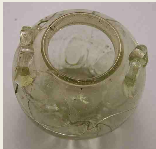
Δοχείο από πρεσαρισμένο γυαλί. Πρώιμη Ισλαμική εποχή, 9ος-10ος αι. Μητροπολιτικό Μουσείο, Νέα Υόρκη

Τον 8ο αιώνα, εμφανίζονται τα φουσητά σε καλούπι γυαλιά, ένα είδος που κυριάρχησε στην παραγωγή του ισλαμικού κόσμου. Η Ανατολή αγαπούσε ιδιαίτερα αυτά το τόσο λεπταίσθητα αντικείμενα και έργα τέχνης. Τα γνώρισε και η Δύση, όταν κατέλαβε τμήμα της Ανατολής μετά το 1098.