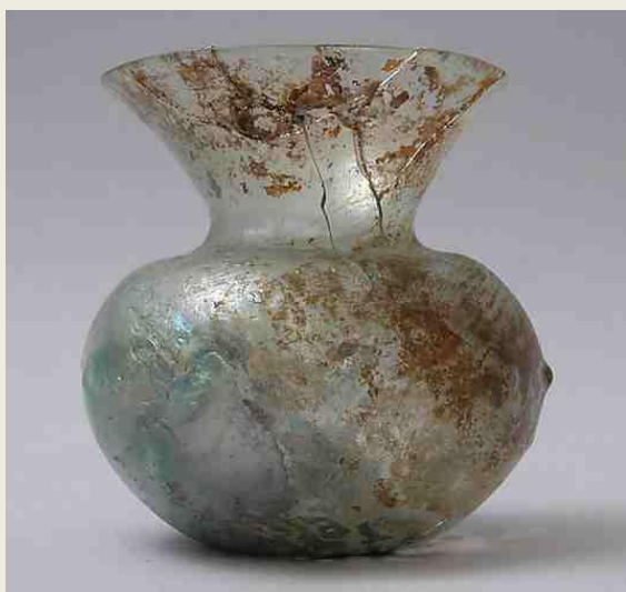
Μικρό αγγείο από φουσητό γυαλί και μεταλλικά ψήγματα που το κάνουν να λαμпуρίζει. Πρωτοβυζαντινή εποχή, 4ος-5ος αι. Μητροπολιτικό Μουσείο, Νέα Υόρκη

Μετά την ίδρυση της Κωνσταντινούπολης, οι συριακοί δρόμοι του εμπορίου του γυαλιού επεκτάθηκαν έως τη Βαλτική. Αλλά οι πιο καλοί πελάτες βρίσκονται στα βυζαντινά εδάφη. Υπήρχαν, μάλιστα, επιχειρηματίες που θέλησαν να φτιάξουν δικά τους εργαστήρια. Συνήθως προσλαμβάνουν Σύριους τεχνίτες. Ορισμένοι μελετητές αναγνωρίζουν σε θραύσματα από υαλοπίνακες της Αγίας Σοφίας «συριακά χέρια».