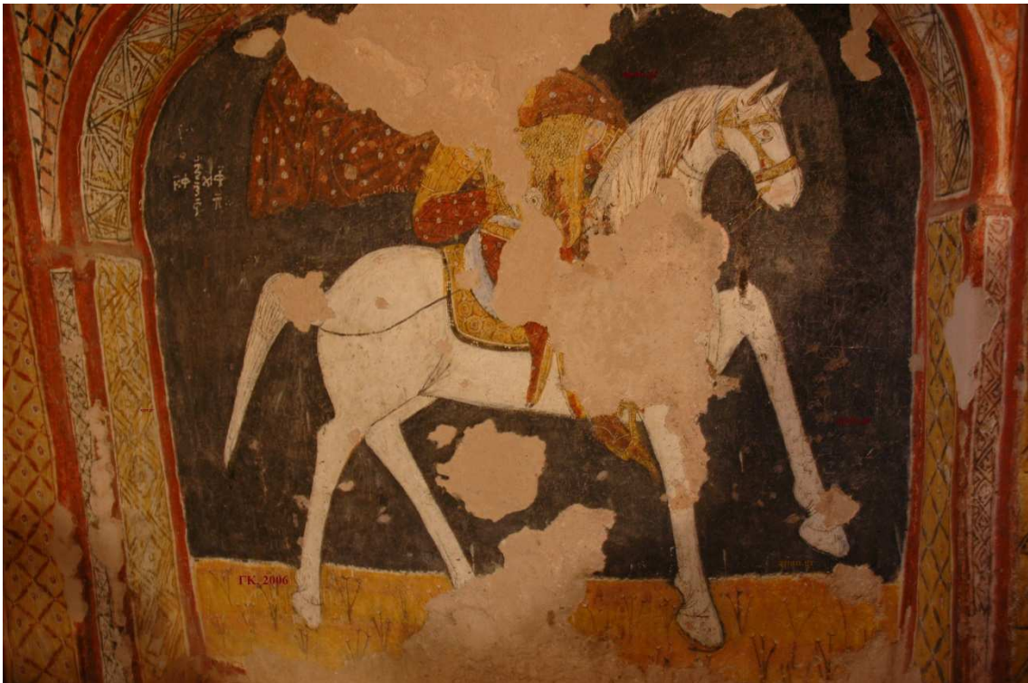
Ναός του αγίου Ιωάννη / Καρσί Κιλισέ, αγιογραφημένος το 1212/13. Ο άγιος Γεώργιος (φωτ ΓΚ, 2006). Η ιπποτρόφος Καππαδοκία προμήθευε τους ισχυρούς του κόσμου με γερά και γρήγορα άλογα

Κι όμως. Από την άγονη, άδενδρη, άξυλη κι αφιλόξενη Καππαδοκία, με τους φοβερούς χειμώνες και τα ανελέητα καλοκαίρια, περνάει ο κυριότερος δρόμος της Δυτικής Ασίας. Οι Ασσύριοι τον χάραξαν πριν από 4.000 χρόνια. Ο βασιλιάς Δαρειός οργάνωσε τους εκατόν δέκα σταθμούς για να αλλάζουν άλογα οι έφιπποι αγγελιοφόροι και να ανεφοδιάζονται όλοι όσοι ταξίδευαν από τις βασιλικές πόλεις των Αχαιμενιδών Περσών προς τις Σάρδεις και το Αιγαίο, ή αντίστροφα. Οι Ρωμαίοι τον ξανάφτιαξαν. Οι Βυζαντινοί τον χλιοπερπάτησαν, οργάνωσαν την άμυνα, φρούρησαν τις κλεισούρες, οχύρωσαν με βασάλτινα τείχη την πρωτεύουσα Καισάρεια –αυτή ήταν η μεγαλούπολη πάνω στον διηπειρωτικό δρόμο. Εδώ, συγκέντρωσε και εκπαίδευσε τον στρατό ο Ηράκλειος για την ηράκλεια εκστρατεία εναντίον των Σασανιδών Περσών, πριν από δεκαπέντε αιώνες. Οι Σελτζούκοι έχτισαν δεκάδες караβάν σαράγια κατά μήκος αυτού του δρόμου. Ένα κάθε 35-40 χλμ. Από την Καισάρεια πέρασε και ο Μάρκο Πόλο, πηγαίνοντας στα ασιατικά ενδότερα και θαύμασε «τα υπέροχα μεταξωτά και τα ωραιότερα χαλιά στον κόσμο, που τα κατασκευάζουν Έλληνες, Αρμένιοι και Τούρκοι». Άλλος βατός και οργανωμένος δρόμος προς τη Μέση Ανατολή δεν υπάρχει.