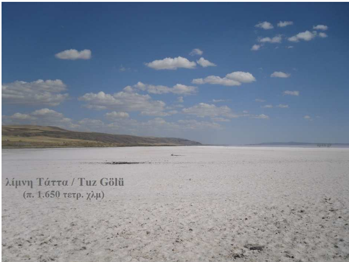
λίμνη Τάττα / Tuz Gölü (π. 1.650 τετρ. χλμ)

Η διάλεξη θα γίνει στο Πανόραμα το απόγευμα της Τετάρτης 23/9 (6.30-9.00) και θα επαναληφθεί το πρωί της Πέμπτης 24/9/2015 (11.00-13.30). Θα μοιραστούν Σημειώσεις. Παρακαλούμε εγγραφείτε εγκαίρως. Προτεραιότητα έχουν τα μέλη του Πανοράματος και οι συνδρομητές του Αρχείου (ΑΠΑΝ).