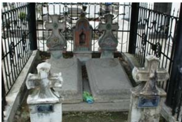
ΜΠΡΑΣΪΟΒ ΕΙΚ. 8

ΟΙΚΟΓΕΝΕΙΑΚΟΣ ΤΑΦΟΣ ΤΩΝ ΣΟΥΤΣΩΝ ΣΤΟ ΕΛΛΗΝΙΚΟ ΚΟΙΜΗΤΗΡΙΟ, ΤΟ ΟΠΟΙΟ ΕΚΤΕΙΝΕΤΑΙ ΣΕ ΕΚΤΑΣΗ 500 ΤΜ ΣΤΗ ΒΟΡΕΙΑ ΠΛΕΥΡΑ ΤΟΥ ΝΑΟΥ. ΑΡΙΣΤΕΡΑ Ο ΤΑΦΟΣ ΤΗΣ ΡΟΧΑΝΔΡΑ , ΚΟΡΗΣ ΤΟΥ ΑΛΕΞΑΝΔΡΟΥ ΣΟΥΤΣΟΥ .