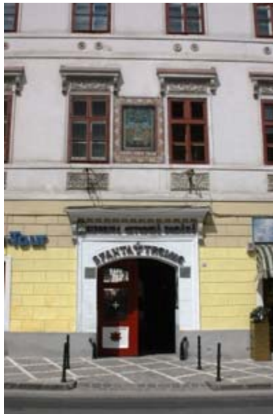
ΜΠΡΑΣΪΟΒ ΕΙΚ. 3

Η ΠΛΑΤΕΙΑ SFATULUI ΟΠΩΣ ΗΤΑΝ ΤΟΝ 17 ο ΑΙΩΝΑ. ΣΕ ΑΥΤΗΝ ΤΗΝ ΠΛΑΤΕΙΑ ΣΥΓΚΕΝΤΡΩΝΟΝΤΑΝ ΟΛΑ ΤΑ ΠΡΟΪΟΝΤΑ ΤΗΣ ΑΝΑΤΟΛΗΣ ΑΠΟ ΤΟΥΣ ΕΛΛΗΝΕΣ ΠΡΑΜΑΤΕΥΤΑΔΕΣ, ΚΥΡΙΩΣ ΗΠΕΙΡΩΤΕΣ ΚΑΙ ΜΑΚΕΔΟΝΕΣ, ΠΟΥ ΑΡΧΙΣΑΝ ΝΑ ΕΓΚΑΘΙΣΤΑΝΤΑΙ ΣΤΟ ΜΠΡΑΣΟΒ ΑΠΟ ΤΟ 1545.