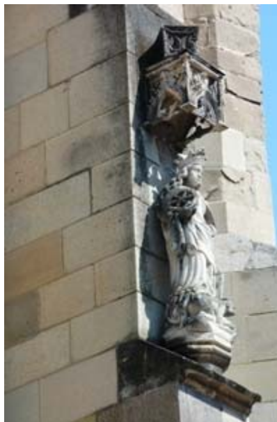
ΜΠΡΑΣΪΟΒ ΕΙΚ. 13 ΜΑΥΡΗ ΕΚΚΛΗΣΙΑ

Ο JOHANNES HONTERUS (1498-1549) ΗΤΑΝ Ο ΜΕΓΑΛΟΣ ΜΕΤΑΡΡΥΘΜΙΣΤΗΣ ΤΩΝ ΣΑΞΟΝΩΝ ΤΗΣ ΤΡΑΝΣΥΛΒΑΝΙΑΣ. ΣΤΗ ΔΥΤΙΚΗ ΠΛΕΥΡΑ ΤΟΥ ΒΑΘΡΟΥ ΜΕ ΤΟ ΑΓΑΛΜΑ ΤΟΥ, ΠΟΥ ΤΟΠΟΘΕΤΗΘΗΚΕ ΜΠΡΟΣΤΑ ΑΠΟ ΤΟΝ ΝΔ ΠΥΡΓΟ ΤΗΣ ΜΑΥΡΗΣ ΕΚΚΛΗΣΙΑΣ ΤΟ 1898, ΥΠΑΡΧΕΙ ΕΝΑ ΧΑΛΚΙΝΟ ΑΝΑΓΛΥΦΟ, ΠΟΥ ΑΠΕΙΚΟΝΙΖΕΙ ΤΟΝ ΠΡΟΤΕΣΤΑΝΤΗ ΙΕΡΕΑ ΣΤΟ ΤΥΠΟΓΡΑΦΕΙΟ ΤΟΥ. ΗΤΑΝ ΤΟ ΤΡΙΤΟ ΑΡΧΑΙΟΤΕΡΟ ΤΥΠΟΓΡΑΦΕΙΟ ΣΤΗ ΡΟΥΜΑΝΙΑ ΚΑΙ ΛΕΙΤΟΥΡΓΗΣΕ ΤΟ 1539.