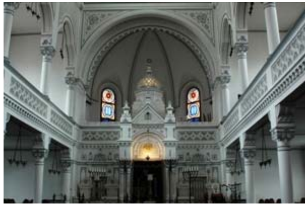
ΜΠΡΑΣΟΒ ΕΙΚ. 17 Η ΕΒΡΑΪΚΗ ΣΥΝΑΓΩΓΗ. ΕΣΩΤΕΡΙΚΟ.

ΕΒΡΑΙΚΗ ΣΥΝΑΓΩΓΗ. ΣΤΟΝ ΑΡΙΘΜΟ 29 ΤΟΥ ΔΡΟΜΟΥ POARTA SCHEI. ΑΠΟ ΤΟ ΜΠΡΑΣΟΒ,ΤΟ ΚΕΝΤΡΟ ΕΜΠΟΡΙΟΥ ΤΗΣ ΤΡΑΝΣΥΛΒΑΝΙΑΣ, ΠΩΣ ΘΑ ΜΠΟΡΟΥΣΑΝ ΝΑ ΛΕΙΠΟΥΝ ΟΙ ΕΒΡΑΙΟΙ; ΚΑΤΟΙΚΟΥΣΑΝ ΣΤΟ ΠΡΟΑΣΤΙΟ ΣΚΕΪ ΒΕΒΑΙΑ, ΕΚΤΟΣ ΤΩΝ ΤΕΙΧΩΝ, ΕΚΕΙ ΟΠΟΥ ΕΜΕΝΑΝ ΚΑΙ ΟΙ ΤΑΠΕΙΝΟΙ ΟΡΘΟΔΟΞΟΙ, ΡΟΥΜΑΝΟΙ ΚΑΙ ΕΛΛΗΝΕΣ.Η ΣΥΝΑΓΩΓΗ ΚΤΙΣΤΗΚΕ ΤΟ 1901 (ΟΤΑΝ ΕΙΧΕ ΕΠΙΤΡΑΠΕΙ Η ΚΑΤΟΙΚΗΣΗ ΕΝΤΟΣ ΤΩΝ ΤΕΙΧΩΝ ΣΕ ΟΛΕΣ ΤΙΣ ΚΟΙΝΟΤΗΤΕΣ) ΚΑΙ ΑΝΑΚΑΙΝΙΣΤΗΚΕ ΤΟ 2001 ΟΠΟΤΕ ΓΙΟΡΤΑΣΤΗΚΑΝ ΤΑ 100 ΧΡΟΝΙΑ ΑΠΟ ΤΗΝ ΙΔΡΥΣΗ ΤΗΣ. ΝΕΟΓΟΤΘΙΚΟΣ ΡΥΘΜΟΣ ΜΕ ΑΡΑΒΙΚΑ ΣΤΟΙΧΕΙΑ.