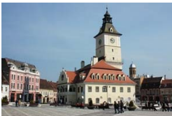
ΜΠΡΑΣΟΒ ΕΙΚ. 1

Η ΑΡΧΙΤΕΚΤΟΝΙΚΗ ΤΩΝ ΣΠΙΤΙΩΝ ΜΑΣ ΠΡΟΪΔΕΑΖΕ ΟΤΙ ΜΠΑΙΝΑΜΕ ΣΤΗΝ ΚΕΝΤΡΙΚΗ ΕΥΡΩΠΗ. ΣΤΟΥΣ ΓΕΡΜΑΝΙΚΟΥΣ ΟΙΚΙΣΜΟΥΣ ΠΡΙΝ ΑΠΟ ΤΟ ΜΠΡΑΣΟΒ ΤΑ ΣΠΙΤΙΑ ΕΙΧΑΝ ΤΙΣ ΠΡΟΣΟΨΕΙΣ ΣΤΟΝ ΔΡΟΜΟ ΚΑΙ ΤΙΣ ΑΥΛΕΣ ΣΤΟ ΠΙΣΩ ΜΕΡΟΣ ΤΩΝ ΣΠΙΤΙΩΝ.