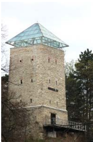
ΜΠΡΑΣΪΟΒ ΕΙΚ. 15

Ο ΜΑΥΡΟΣ ΠΥΡΓΟΣ (TURNUL NEGRU). ΒΡΙΣΚΕΤΑΙ ΣΤΟΝ ΛΟΦΟ STRAJA, ΚΟΝΤΑ ΣΤΟΝ ΠΡΟΜΑΧΩΝΑ ΤΗΣ ΣΥΝΤΕΧΝΙΑΣ ΤΩΝ ΣΙΔΕΡΑΔΩΝ ΠΟΥ ΗΤΑΝ ΚΑΙ ΥΠΕΥΘΥΝΟΙ ΓΙΑ ΑΥΤΟ ΤΟΝ ΠΥΡΓΟ. ΚΤΙΣΤΗΚΕ ΤΟ 1494 ΚΑΙ ΠΗΡΕ ΤΟ ΟΝΟΜΑ ΤΟΥ ΤΟ ΚΑΛΟΚΑΙΡΙ ΤΟΥ 1559, ΟΤΑΝ ΞΕΣΠΑΣΕ ΠΥΡΚΑΓΙΑ ΑΠΟ ΕΝΑΝ ΚΕΡΑΥΝΟ ΠΟΥ ΧΤΥΠΗΣΕ ΤΟΝ ΠΥΡΓΟ. ΟΙ ΕΡΓΑΣΙΕΣ ΑΝΑΣΤΗΛΩΣΗΣ ΔΙΗΡΚΕΣΑΝ ΑΠΟ ΤΟ 1996 ΜΕΧΡΙ ΤΟ 2001, ΟΠΟΤΕ ΑΝΟΙΞΕ ΓΙΑ ΤΟ ΚΟΙΝΟ. ΕΚΤΙΘΕΤΑΙ ΜΟΝΙΜΗ ΣΥΛΛΟΓΗ, ΑΠΟ ΤΟ ΜΟΥΣΕΙΟ ΤΗΣ ΙΣΤΟΡΙΑΣ ΤΗΣ ΠΟΛΗΣ, ΜΕ ΑΝΤΙΚΕΙΜΕΝΑ ΑΠΟ ΤΙΣ ΣΥΝΤΕΧΝΙΕΣ ΤΩΝ ΡΑΦΤΑΔΩΝ ΚΑΙ ΣΙΔΕΡΑΔΩΝ.