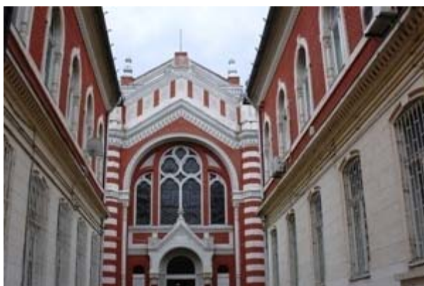
ΜΠΡΑΣΪΟΒ ΕΙΚ. 16

Ο ΜΑΥΡΟΣ ΠΥΡΓΟΣ (TURNUL NEGRU). ΒΡΙΣΚΕΤΑΙ ΣΤΟΝ ΛΟΦΟ STRAJA, ΚΟΝΤΑ ΣΤΟΝ ΠΡΟΜΑΧΩΝΑ ΤΗΣ ΣΥΝΤΕΧΝΙΑΣ ΤΩΝ ΣΙΔΕΡΑΔΩΝ ΠΟΥ ΗΤΑΝ ΚΑΙ ΥΠΕΥΘΥΝΟΙ ΓΙΑ ΑΥΤΟ ΤΟΝ ΠΥΡΓΟ. ΚΤΙΣΤΗΚΕ ΤΟ 1494 ΚΑΙ ΠΗΡΕ ΤΟ ΟΝΟΜΑ ΤΟΥ ΤΟ ΚΑΛΟΚΑΙΡΙ ΤΟΥ 1559, ΟΤΑΝ ΞΕΣΠΑΣΕ ΠΥΡΚΑΓΙΑ ΑΠΟ ΕΝΑΝ ΚΕΡΑΥΝΟ ΠΟΥ ΧΤΥΠΗΣΕ ΤΟΝ ΠΥΡΓΟ. ΟΙ ΕΡΓΑΣΙΕΣ ΑΝΑΣΤΗΛΩΣΗΣ ΔΙΗΡΚΕΣΑΝ ΑΠΟ ΤΟ 1996 ΜΕΧΡΙ ΤΟ 2001, ΟΠΟΤΕ ΑΝΟΙΞΕ ΓΙΑ ΤΟ ΚΟΙΝΟ. ΕΚΤΙΘΕΤΑΙ ΜΟΝΙΜΗ ΣΥΛΛΟΓΗ, ΑΠΟ ΤΟ ΜΟΥΣΕΙΟ ΤΗΣ ΙΣΤΟΡΙΑΣ ΤΗΣ ΠΟΛΗΣ, ΜΕ ΑΝΤΙΚΕΙΜΕΝΑ ΑΠΟ ΤΙΣ ΣΥΝΤΕΧΝΙΕΣ ΤΩΝ ΡΑΦΤΑΔΩΝ ΚΑΙ ΣΙΔΕΡΑΔΩΝ.