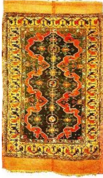
ΜΠΡΑΣΪΟΒ ΕΙΚ. 18 ΧΑΛΙ ΤΟΥ 16 ΟΥ ΑΙΩΝΑ ΑΠΟ ΤΟ ΜΙΚΡΑΣΙΑΤΙΚΟ USHAK

ΠΡΙΝ ΑΠΟ ΤΟ ΠΑΝΟΡΑΜΙΚΟ ΤΑΞΙΔΙ ΣΤΗ ΡΟΥΜΑΝΙΑ, ΗΤΑΝ ΑΔΥΝΑΤΟ ΝΑ ΦΑΝΤΑΣΤΩ ΠΩΣ ΜΠΟΡΕΙ ΝΑ ΣΥΝΔΕΕΤΑΙ ΕΝΑ ΧΑΛΙ ΑΠΟ ΤΟ USHAK Η ΤΑ ΚΥΛΑ ΤΗΣ ΜΙΚΡΑΣ ΑΣΙΑΣ ΜΕ ΤΗ ΓΕΡΜΑΝΟΤΡΑΦΗ ΤΡΑΝΣΥΛΒΑΝΙΑ. ΤΟ ΠΙΟ ΕΝΤΥΠΩΣΙΑΚΟ ΚΑΙ ΠΕΡΙΕΡΓΟ ΠΡΑΓΜΑ ΠΟΥ ΣΥΝΑΝΤΑ ΚΑΝΕΙΣ, ΕΙΝΑΙ Η ΔΙΑΚΟΣΜΗΣΗ ΤΩΝ ΠΡΟΤΕΣΤΑΝΤΙΚΩΝ ΕΚΚΛΗΣΙΩΝ ΜΕ ΑΝΑΤΟΛΙΤΙΚΑ ΧΑΛΙΑ. ΤΟ ΕΜΠΟΡΙΟ ΤΑ ΕΦΕΡΕ ΣΤΗ ΔΥΣΗ ΚΑΙ ΕΤΣΙ ΟΙ ΠΛΟΥΣΙΟΙ ΣΑΞΩΝΕΣ ΚΑΙ ΟΙ ΠΑΝΙΣΧΥΡΕΣ ΣΥΝΤΕΧΝΙΕΣ ΤΑ ΔΩΡΙΖΑΝ ΣΤΙΣ ΕΚΚΛΗΣΙΕΣ, ΑΦΟΥ ΠΡΟΗΓΟΥΜΕΝΩΣ ΕΙΧΑΝ ΑΦΑΙΡΕΣΕΙ ΑΠΟ ΤΟΥΣ ΝΑΟΥΣ ΟΛΕΣ ΤΙΣ ΕΙΚΟΝΕΣ ΚΑΙ ΤΟΙΧΟΓΡΑΦΙΕΣ. ΕΤΣΙ, ΤΑ ΧΑΛΙΑ ΤΗΣ ΑΝΑΤΟΛΗΣ, ΜΕ ΤΑ ΠΕΡΙΤΕΧΝΑ ΣΧΕΔΙΑ ΚΑΙ ΤΑ ΥΠΕΡΟΧΑ ΧΡΩΜΑΤΑ, ΖΕΣΤΑΝΑΝ ΤΙΣ ΤΕΡΑΣΤΙΕΣ, ΚΡΥΕΣ ΚΑΙ ΚΕΝΕΣ ΠΡΟΤΕΣΤΑΝΤΙΚΕΣ ΕΚΚΛΗΣΙΕΣ. (ΣΗΜ. Η φωτογραφία με το χαλί του 16 ου αι., από το USHAK , είναι από το βιβλίο του Stefano Ionescu , “ The Lutheran Churches of Transylvania and Their Rugs ” .