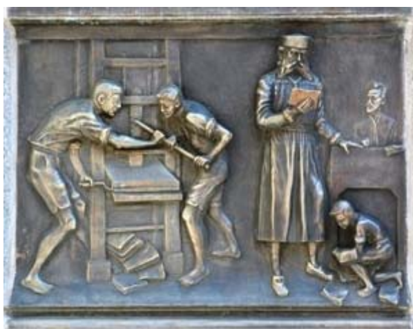
ΜΠΡΑΣΩΒ ΕΙΚ. 12 ΜΑΥΡΗ ΕΚΚΛΗΣΙΑ

Η ΜΑΥΡΗ ΕΚΚΛΗΣΙΑ ΔΕΣΠΟΖΕΙ ΜΕ ΤΟΝ ΟΓΚΟ ΤΗΣ ΣΤΗ ΜΕΣΑΙΩΝΙΚΗ ΠΟΛΗ ΤΟΥ ΜΠΡΑΣΩΒ. ΣΕ ΕΝΑΝ ΑΠΟ ΤΟΥΣ ΕΞΩΤΕΡΙΚΟΥΣ ΠΑΡΑΣΤΑΔΕΣ ΤΟΥ ΣΗΚΟΥ, ΣΤΗ ΝΟΤΙΑ ΠΛΕΥΡΑ, ΑΠΕΙΚΟΝΙΖΕΤΑΙ ΕΝΑΣ ΝΕΑΡΟΣ ΑΝΤΡΑΣ ΠΟΥ ΚΟΙΤΑΖΕΙ ΠΡΟΣ ΤΑ ΚΑΤΩ ΑΠΟ ΤΗΝ ΟΡΟΦΗ ΤΗΣ ΕΚΚΛΗΣΙΑΣ. ΣΥΜΦΩΝΑ ΜΕ ΤΗΝ ΠΑΡΑΔΟΣΗ ΑΠΕΙΚΟΝΙΖΕΤΑΙ Ο ΙΚΑΝΟΤΕΡΟΣ ΜΑΘΗΤΕΥΟΜΕΝΟΣ ΚΑΤΑ ΤΟ ΚΤΙΣΜΟ ΤΗΣ ΕΚΚΛΗΣΙΑΣ. Ο ΑΡΧΙΜΑΣΤΟΡΑΣ ΟΜΩΣ ΑΠΟ ΖΗΛΕΙΑ ΚΑΙ ΦΟΒΟ ΟΤΙ ΘΑ ΤΟΥ ΠΑΡΕΙ ΤΗ ΘΕΣΗ ΤΟΝ ΕΣΠΡΩΞΕ ΚΑΙ Ο ΝΕΑΡΟΣ ΣΚΟΤΩΘΗΚΕ. ΑΡΓΟΤΕΡΑ, Ο ΑΡΧΙΜΑΣΤΟΡΑΣ ΟΜΟΛΟΓΗΣΕ ΤΗΝ ΠΡΑΞΗ ΤΟΥ ΚΑΙ ΕΚΤΕΛΕΣΤΗΚΕ.