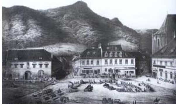
ΜΠΡΑΣΪΟΒ ΕΙΚ. 2

Η ΠΛΑΤΕΙΑ SFATULUI ΟΠΩΣ ΗΤΑΝ ΤΟΝ 17 ο ΑΙΩΝΑ. ΣΕ ΑΥΤΗΝ ΤΗΝ ΠΛΑΤΕΙΑ ΣΥΓΚΕΝΤΡΩΝΟΝΤΑΝ ΟΛΑ ΤΑ ΠΡΟΪΟΝΤΑ ΤΗΣ ΑΝΑΤΟΛΗΣ ΑΠΟ ΤΟΥΣ ΕΛΛΗΝΕΣ ΠΡΑΜΑΤΕΥΤΑΔΕΣ, ΚΥΡΙΩΣ ΗΠΕΙΡΩΤΕΣ ΚΑΙ ΜΑΚΕΔΟΝΕΣ, ΠΟΥ ΑΡΧΙΣΑΝ ΝΑ ΕΓΚΑΘΙΣΤΑΝΤΑΙ ΣΤΟ ΜΠΡΑΣΟΒ ΑΠΟ ΤΟ 1545.