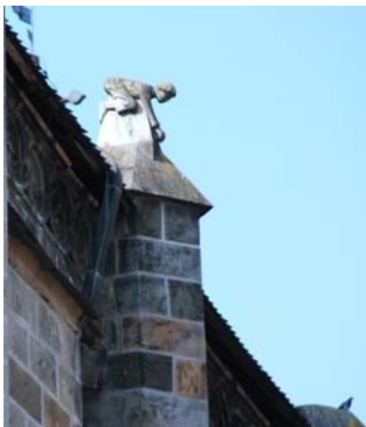
ΜΠΡΑΣΩΒ ΕΙΚ. 11

Η ΜΑΥΡΗ ΕΚΚΛΗΣΙΑ ΔΕΣΠΟΖΕΙ ΜΕ ΤΟΝ ΟΓΚΟ ΤΗΣ ΣΤΗ ΜΕΣΑΙΩΝΙΚΗ ΠΟΛΗ ΤΟΥ ΜΠΡΑΣΩΒ. ΣΕ ΕΝΑΝ ΑΠΟ ΤΟΥΣ ΕΞΩΤΕΡΙΚΟΥΣ ΠΑΡΑΣΤΑΔΕΣ ΤΟΥ ΣΗΚΟΥ, ΣΤΗ ΝΟΤΙΑ ΠΛΕΥΡΑ, ΑΠΕΙΚΟΝΙΖΕΤΑΙ ΕΝΑΣ ΝΕΑΡΟΣ ΑΝΤΡΑΣ ΠΟΥ ΚΟΙΤΑΖΕΙ ΠΡΟΣ ΤΑ ΚΑΤΩ ΑΠΟ ΤΗΝ ΟΡΟΦΗ ΤΗΣ ΕΚΚΛΗΣΙΑΣ. ΣΥΜΦΩΝΑ ΜΕ ΤΗΝ ΠΑΡΑΔΟΣΗ ΑΠΕΙΚΟΝΙΖΕΤΑΙ Ο ΙΚΑΝΟΤΕΡΟΣ ΜΑΘΗΤΕΥΟΜΕΝΟΣ ΚΑΤΑ ΤΟ ΚΤΙΣΜΟ ΤΗΣ ΕΚΚΛΗΣΙΑΣ. Ο ΑΡΧΙΜΑΣΤΟΡΑΣ ΟΜΩΣ ΑΠΟ ΖΗΛΕΙΑ ΚΑΙ ΦΟΒΟ ΟΤΙ ΘΑ ΤΟΥ ΠΑΡΕΙ ΤΗ ΘΕΣΗ ΤΟΝ ΕΣΠΡΩΞΕ ΚΑΙ Ο ΝΕΑΡΟΣ ΣΚΟΤΩΘΗΚΕ. ΑΡΓΟΤΕΡΑ, Ο ΑΡΧΙΜΑΣΤΟΡΑΣ ΟΜΟΛΟΓΗΣΕ ΤΗΝ ΠΡΑΞΗ ΤΟΥ ΚΑΙ ΕΚΤΕΛΕΣΤΗΚΕ.