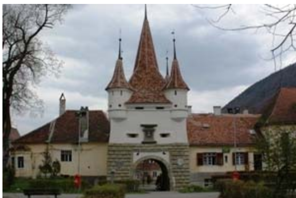
ΜΠΡΑΣΟΒ ΕΙΚ. 10

ΠΥΛΗ ΤΗΣ ΑΙΚΑΤΕΡΙΝΗΣ. ΕΙΝΑΙ Η ΜΟΝΑΔΙΚΗ ΠΟΥ ΔΙΑΣΩΘΗΚΕ ΑΠΟ ΤΙΣ ΠΥΛΕΣ ΤΗΣ ΤΕΙΧΙΣΜΕΝΗΣ ΜΕΣΑΙΩΝΙΚΗΣ ΠΟΛΗΣ ΤΟΥ ΜΠΡΑΣΟΒ (ΤΟΥ ΚΡΟΝΣΤΑΝΤ ΤΩΝ ΣΑΞΟΝΩΝ ΙΔΡΥΤΩΝ ΤΗΣ ΠΟΛΗΣ). ΜΕΧΡΙ ΤΟ 1820 ΗΤΑΝ Η ΜΟΝΗ ΠΡΟΣΒΑΣΗ ΑΠΟ ΤΟ ΠΡΟΑΣΤΙΟ ΣΚΕΪ, ΟΠΟΥ ΔΙΕΜΕΙΝΑΝ ΟΙ ΔΕΥΤΕΡΗΣ ΚΑΤΗΓΟΡΙΑΣ ΚΑΤΟΙΚΟΙ ΤΗΣ ΠΟΛΗΣ: ΟΙ ΟΡΘΟΔΟΞΟΙ ΡΟΥΜΑΝΟΙ ΚΑΙ ΕΛΛΗΝΕΣ (ΔΕΝ ΕΠΙΤΡΕΠΟΝΤΑΝ Η ΕΙΣΟΔΟΣ ΤΟΥΣ ΣΤΗΝ ΠΟΛΗ ΑΠΟ ΑΛΛΗ ΠΥΛΗ, ΑΛΛΑ ΚΙ ΕΔΩ, ΦΤΙΑΧΤΗΚΕ ΜΙΑ ΔΙΠΛΑΝΗ ΠΥΛΙΔΑ ΓΙΑ ΤΟΥΣ ΟΡΘΟΔΟΞΟΥΣ, Η ΛΕΓΟΜΕΝΗ «ΠΥΛΗ ΤΟΥ ΣΚΕΪ» ΚΟΝΤΑ ΣΕ ΑΥΤΗΝ ΤΗΣ ΑΙΚΑΤΕΡΙΝΗΣ). Ο ΠΥΡΓΟΣ ΤΗΣ ΠΥΛΗΣ ΕΙΝΑΙ ΤΟ ΜΟΝΟ ΣΤΟΙΧΕΙΟ ΠΟΥ ΕΧΕΙ ΑΠΟΜΕΙΝΕΙ ΑΠΟ ΤΟ ΟΛΟ ΟΧΥΡΩΜΑΤΙΚΟ ΣΥΓΚΡΟΤΗΜΑ. ΟΙ ΥΠΟΛΟΙΠΕΣ ΟΧΥΡΩΣΕΙΣ ΤΗΣ ΠΥΛΗΣ ΚΑΤΕΔΑΦΙΣΤΗΚΑΝ ΤΟ 1827, ΟΤΑΝ ΚΤΙΣΤΗΚΕ Η ΠΥΛΗ ΣΚΕΙ. ΣΤΗΝ ΠΡΟΣΟΨΗ, ΠΑΝΩ ΑΠΟ ΤΗΝ ΚΑΜΑΡΑ, ΥΠΑΡΧΟΥΝ ΣΚΑΛΙΣΜΕΝΑ ΤΟ ΕΜΒΛΗΜΑ ΤΗΣ ΠΟΛΗΣ ΤΟΥ ΜΠΡΑΣΟΒ, ΤΟ ΟΝΟΜΑ ΤΟΥ ΔΗΜΟΤΙΚΟΥ ΣΥΜΒΟΥΛΟΥ JOHANNES BENKNER ΚΑΙ ΤΟ ΕΤΟΣ ΚΑΤΑΣΚΕΥΗΣ, 1559 . Η ΠΥΛΗ ΑΝΑΚΑΙΝΙΣΤΗΚΕ ΤΟ 1971-1973 ΚΑΙ ΤΟ 2006.