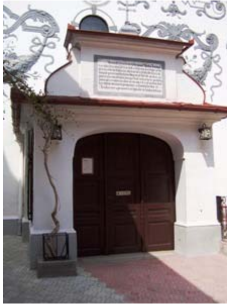
ΜΠΡΑΣΪΟΒ ΕΙΚ. 5 Η ΕΙΣΟΔΟΣ ΤΟΥ ΕΞΩΝΑΡΘΗΚΑ

Ο ΕΞΩΝΑΡΘΗΚΑΣ ΠΡΟΣΤΕΘΗΚΕ ΣΤΙΣ ΑΝΑΚΑΙΝΙΣΤΙΚΕΣ ΕΡΓΑΣΙΕΣ ΠΟΥ ΕΓΙΝΑΝ ΤΟ 1776-77. ΣΤΟ ΥΠΕΡΘΥΡΟ ΥΠΗΡΧΕ ΜΙΑ ΜΑΡΜΑΡΙΝΗ ΕΠΙΓΡΑΦΗ ΑΠΟ ΤΟ 1888, ΟΠΟΥ ΕΙΧΕ ΣΚΑΛΙΣΤΕΙ ΤΟ ΕΞΗΣ ΚΕΙΜΕΝΟ: «ΑΓΙΑ ΤΡΙΑΣ /ΟΡΘΟΔΟΞΟΣ ΕΛΛΗΝΙΚΟΣ ΝΑΟΣ ΤΗΣ ΕΝ/ΒΡΑΣΣΟΒΩ ΟΡΘΟΔΟΞΟΥ ΕΛΛΗΝΙΚΗΣ ΚΟΙΝΟΤΗΤΟΣ /ΥΜΝΩ ΤΟΝ ΥΨΙΣΤΟΝ ΕΛΛΗΝΙΣΤΙ».