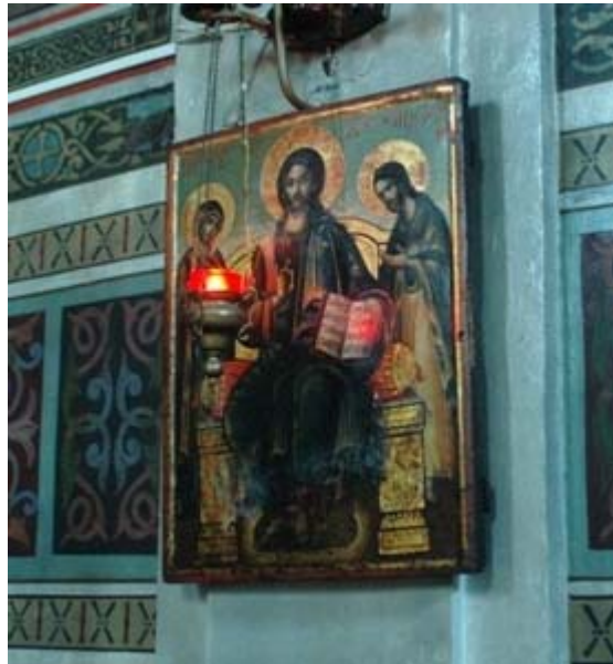
ΜΠΡΑΣΨΟΒ ΕΙΚ. 7 ΣΤΗΝ ΑΓΙΑ ΤΡΙΑΔΑ: ΕΙΚΟΝΑ ΤΗΣ ΔΕΗΣΗΣ ΣΤΟ ΜΕΤΩΠΟ ΤΟΥ ΝΟΤΙΟΥ ΤΟΙΧΟΥ.

ΠΑΡΑ ΥΨΙΣΤΟΥ ΒΑΣΙΛΙΑ ΙΩΣΗΦ ΤΟΥ Β, ΜΕ/ ΤΗΝ ΑΔΕΙΑ ΤΟΥ ΤΙΜΙΟΥ ΔΙΚΑΣΤΗ ΤΗΣ ΠΟΛΕΩΣ ΠΡΟΣ / ΩΦΕΛΕΙΑ ΤΩΝ ΝΥΝ ΠΙΣΤΩΝ, ΟΠΩΣ ΚΑΙ ΤΩΝ ΑΠΟΓΟΝΩΝ/ ΤΟΥΣ, ΠΡΟΣ ΑΙΩΝΙΑ ΜΝΗΜΗ ΤΩΝ ΚΤΗΤΟΡΩΝ ΤΟΥ/ΜΕΤΑΦΡΑΣΗ ΤΗΣ ΠΡΩΤΟΤΥΠΗΣ ΕΠΙΓΡΑΦΗΣ ΑΠΟ ΤΗ ΛΑΤΙΝΙΚΗ ΓΛΩΣΣΑ».