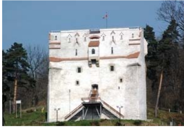
ΜΠΡΑΣΟΒ ΕΙΚ. 14

Ο ΛΕΥΚΟΣ ΠΥΡΓΟΣ (TURNUL ALB). Η ΜΕΣΑΙΩΝΙΚΗ ΠΟΛΗ ΤΟΥ ΜΠΡΑΣΟΒ ΕΚΤΟΣ ΑΠΟ ΤΟ ΤΕΙΧΟΣ ΠΟΥ ΤΗΝ ΠΕΡΙΕΒΑΛΛΕ (ΟΠΟΥ ΚΑΤΟΙΚΟΥΣΑΝ ΑΠΟΚΛΕΙΣΤΙΚΑ ΚΑΙ ΜΟΝΟΝ ΤΕΥΤΟΝΕΣ, ΣΑΞΟΝΕΣ ΚΑΙ ΟΥΓΓΡΟΙ ), ΠΡΟΣΤΑΤΕΥΟΤΑΝ ΚΑΙ ΑΠΟ 32 ΠΥΡΓΟΥΣ ΧΤΙΣΜΕΝΟΥΣ ΠΕΡΙΜΕΤΡΙΚΑ ΣΤΑ ΒΟΥΝΑ. ΚΑΘΕ ΜΙΑ ΑΠΟ ΤΙΣ 20 ΕΠΑΓΓΕΛΜΑΤΙΚΕΣ ΣΥΝΤΕΧΝΙΕΣ ΧΡΕΩΝΟΤΑΝ ΕΝΑΝ Ή ΔΥΟ ΠΥΡΓΟΥΣ ΟΙ ΟΠΟΙΟΙ ΕΦΕΡΑΝ ΚΑΙ ΤΟ ΟΝΟΜΑ ΤΗΣ ΣΥΝΤΕΧΝΙΑΣ. ΕΠΟΜΕΝΩΣ ΟΙ ΣΥΝΤΕΧΝΙΕΣ ΔΙΑΤΗΡΟΥΣΑΝ ΣΤΡΑΤΟ Ή ΑΣΚΟΥΝΤΑΝ ΣΤΑ ΟΠΛΑ ΚΑΙ ΟΠΛΙΖΟΝΤΑΝ ΤΑ ΙΔΙΑ ΤΑ ΜΕΛΗ ΤΟΥΣ. ΕΚΤΟΣ ΑΠΟ ΤΟΝ ΑΜΥΝΤΙΚΟ ΣΚΟΠΟ, ΟΙ ΠΥΡΓΟΙ ΛΕΙΤΟΥΡΓΟΥΣΑΝ ΚΑΙ ΩΣ ΠΑΡΑΤΗΡΗΤΗΡΙΑ ΓΙΑ ΤΙΣ ΕΧΘΡΙΚΕΣ ΕΠΙΔΡΟΜΕΣ ΚΑΙ ΓΙΑ ΤΙΣ ΠΥΡΚΑΓΙΕΣ. Ο ΛΕΥΚΟΣ ΠΥΡΓΟΣ (ΕΙΚ. 14) ΒΡΙΣΚΕΤΑΙ ΣΤΟ ΛΟΦΟ WARTHE , ΣΤΟ ΨΗΛΟΤΕΡΟ ΣΗΜΕΙΟ ΠΑΝΩ ΑΠΟ ΤΗΝ ΠΟΛΗ ΚΑΙ ΥΠΕΥΘΥΝΗ ΓΙΑ ΤΗ ΣΥΝΤΗΡΗΣΗ ΚΑΙ ΥΠΕΡΣΠΙΣΗ ΤΟΥ ΗΤΑΝ Η ΣΥΝΤΕΧΝΙΑ ΤΩΝ ΓΑΝΩΜΑΤΗΔΩΝ . ΚΤΙΣΤΗΚΕ ΤΟ 1460 (Η ΤΟ 1494 ΣΥΜΦΩΝΑ ΜΕ ΑΛΛΕΣ ΠΗΓΕΣ) ΚΑΙ ΕΧΕΙ ΥΨΟΣ 20 ΜΕΤΡΑ. ΑΝΑΚΑΙΝΙΣΤΗΚΕ ΤΟ 2006.