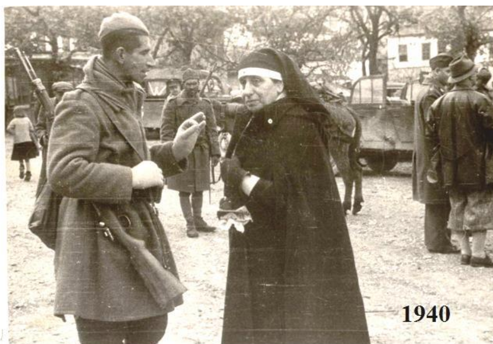
Η Μάνα του Στρατού στο Αργυρόκαστρο