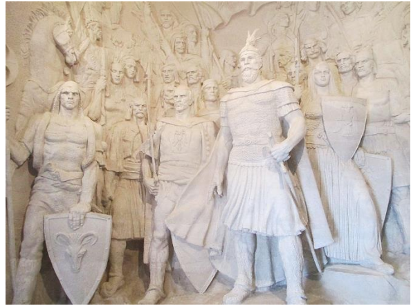
Ο Γεώργιος Καστριώτης Σκεντέρμπεης και οι άντρες του (ανάγλυφο στα Κρούγια)