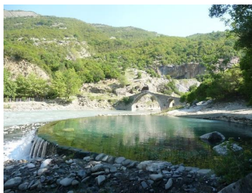
Αώος / Vjosë ή και Αοός. Ο ποταμός πηγάζει στην Πίνδο (Ελλάδα) και εκβάλλει στην Αδριατική (Αλβανία)