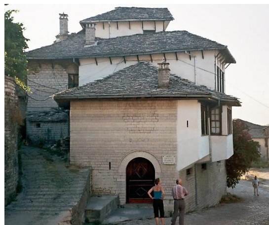
Αργυρόκαστρο, γενική άποψη της παλαιάς πόλης και το σπίτι του Εμβέρ Χότζα (1908-1985)