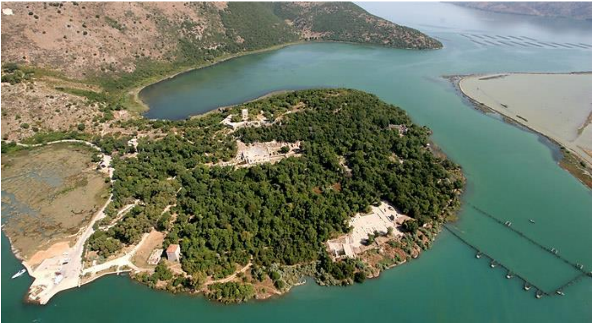
Εικόνες από το θαυμάσιο Βουθρωτό κοντά στα σύνορα Αλβανίας-Ελλάδας