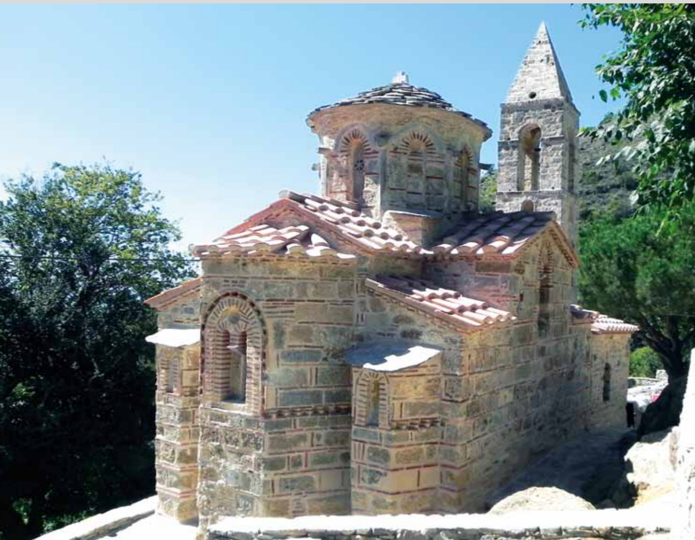
Ο ναός μετά τις αναστηλωτικές εργασίες The church after the restoration interventions

Παράλληλα, δεκάδες σημαντικά μνημεία διασώθηκαν από την κατάρρευση και την εγκατάλειψη, σε όλη τη χώρα ή εκτός συνόρων, όπως για