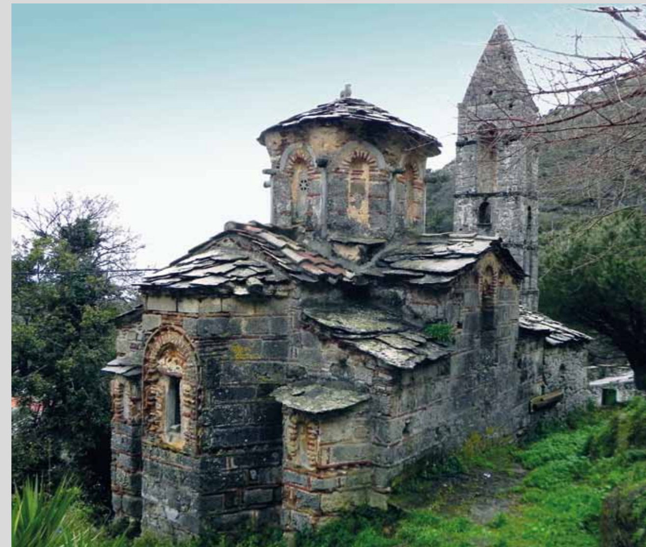
Ο ναός πριν τις αναστηλωτικές εργασίες The church before the restoration interventions

Τμήμα των τοιχογραφιών υπέστη μια κακότεχνη επιζωγράφηση, το μεγαλύτερο μέρος της οποίας αφαιρέθηκε κατά την πρόσφατη συντήρησή τους. Σε μεγαλύτερη έκταση σώζεται το δεύτερο στρώμα ζωγραφικής που συνιστά και την κύρια φάση τοιχογράφησης του ναού. Χρονολογείται, βάσει τεχνολογικών και εικονογραφικών κριτηρίων, στο δεύτερο μισό του 14ου αιώνα και απηχεί τις τάσεις της μνημειακής ζωγραφικής στην περιοχή του Μυστρά κατά την όψιμη παλαιολόγια περίοδο. Κατά τις πρόσφατες εργασίες συντήρησης αποκαλύφθηκαν τρία στρώματα τοιχογραφιών και στον χώρο του ναού, όλα των βυζαντινών χρόνων.