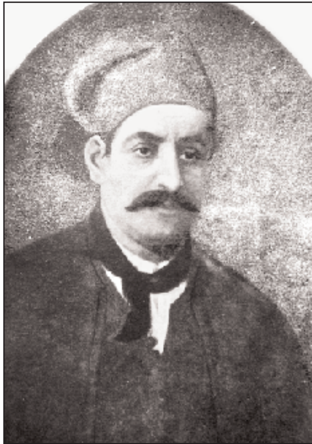
Ο Σπετσιώτης καπετάνιος Ανάργυρος Λεμπέσης, από τους πρωταγωνιστές της νικηφόρας ναυμαχίας του Γέροντα (1824). «Πέντε φεργάδες έβαλε στην κάσα η Ναβέτα /.../ Να ήταν δύο σαν τη Ναβέτα / κάνουν την αρμάδα νέτα», δημώδες.

Το κορυφαίο όμως τόλμημα των θρυλικών ναυμάχων του νησιού είναι η απόκρουση του τουρκικού στόλου στον πορθμό των Σπετσών. Στις 8 Σεπτεμβρίου 1822 ο τουρκοαιγυπτιακός στόλος φάνηκε απειλητικός ανατολικά των Σπετσών. Οι Τούρκοι σκόπευαν να προβούν στην καταστροφή των Σπετσών πρώτα και της Υδρας κατόπιν και να επιστήσουν στη συνέχεια το πολιορκούμενο