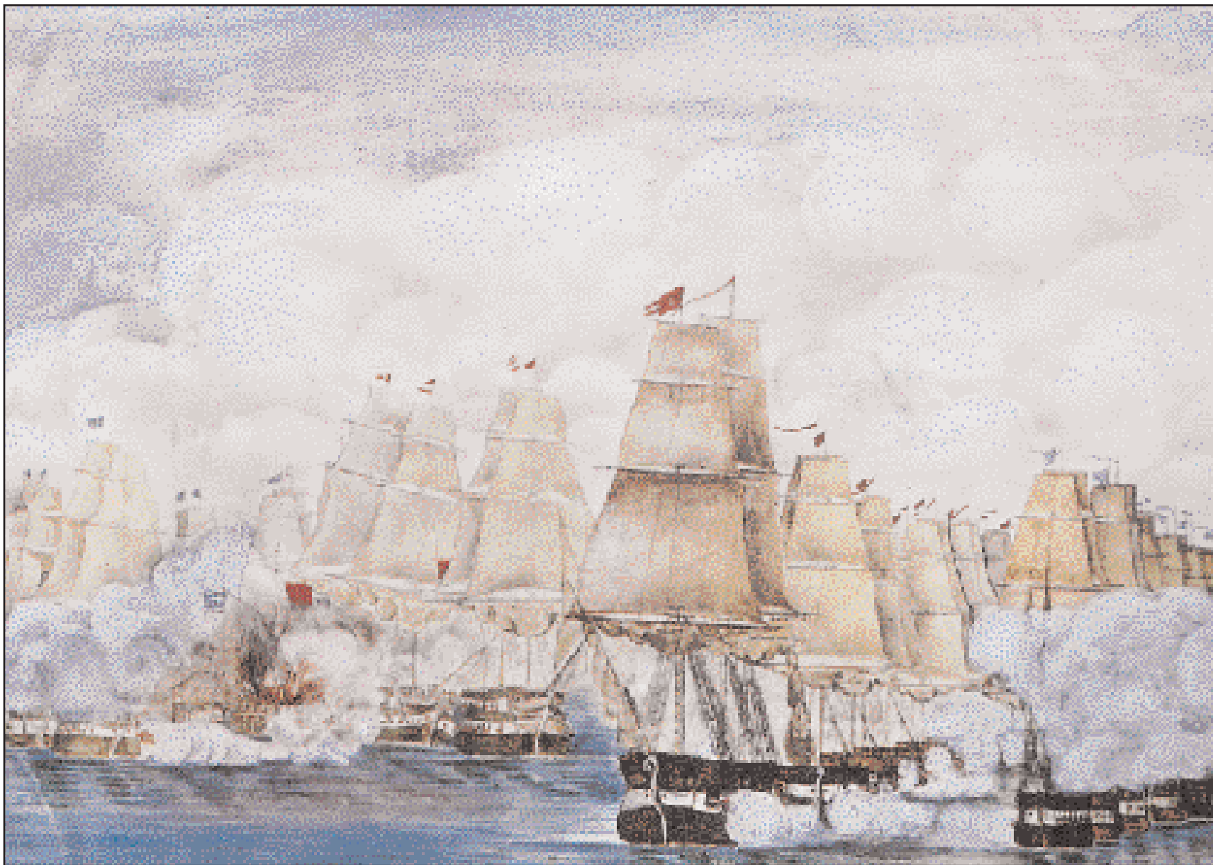
«Ναυμαχία στο στενό Υδρας - Σπετσών», πίνακας άγνωστου λαϊκού καλλιτέχνη, εμπνευσμένος από τη σωτήρια για τις Σπέτσες νίκη του τριήσιου –Υδρα, Σπέτσες, Ψαρά– ελληνικού στόλου επί του τουρκοαιγυπτιακού, τον Σεπτέμβριο του 1822. Εθνικό Ιστορικό Μουσείο.