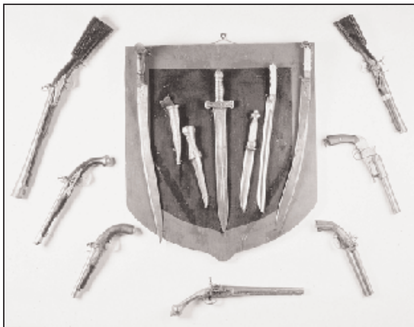
Συλλογή αγχέμαχων όπλων και πυροβόλων της εποχής της ελληνικής Επανάστασης. Μουσείο Μπουμπουλίνας, Σπέτσες.

Αμέσως οι Σπετσιώτες συγκροτούν τοπική διοίκηση και αρχίζουν τη δράση. Εντεκα καράβια τραβούν κατά τη Μονεμβασιά. Αλλα οκτώ, ανάμεσα στα οποία ξεχωρίζουν ο «Αγαμέμνων» της Λασκαρίνας Μπουμπουλίνας και ο «Διομήδης» των Μποτσαίων, αναχωρούν για το Ναύπλιο! Ετσι πρώτοι οι Σπετσιώτες από όλους τους νησιώτες μπαίνουν στον Αγώνα και αποκλείουν ζωτικά κάστρα του εχθρού. Κινούνται προς όλες τις κατευθύνσεις, μοιράζουν επαναστατικές προκηρύξεις και ξεσηκώνουν τους διστακτικούς. Ενεργούν αποβάσεις και πολιορκίες, εφορμούν εναντίον κάθε τουρκικού πλοίου, το συλλαμβάνουν και το καθιστούν λεία του πολέμου. Ο επαναστατικός ενθουσιασμός τους είναι απερίγραπτος. Πρώτοι οι Πελοποννήσιοι με επιστολή τους της 9ης Απριλίου αναγνωρίζουν την επαναστατι-