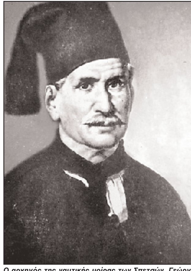
Ο αρχηγός της ναυτικής μοίρας των Σπετσών, Γεώργ. Ανδρούτσος, επικεφαλής, μαζί με τους Γ. Σαχτούρη και Ν. Αποστόλη, της ελληνικής ναυτικής δύναμης που καταναυμάχησε τον αιγυπτιακό στόλο μεταξύ Κάβο Ντόρο και Ανδρου, τον Μάιο του 1825 – Ναυμαχία του Καφηρέα.