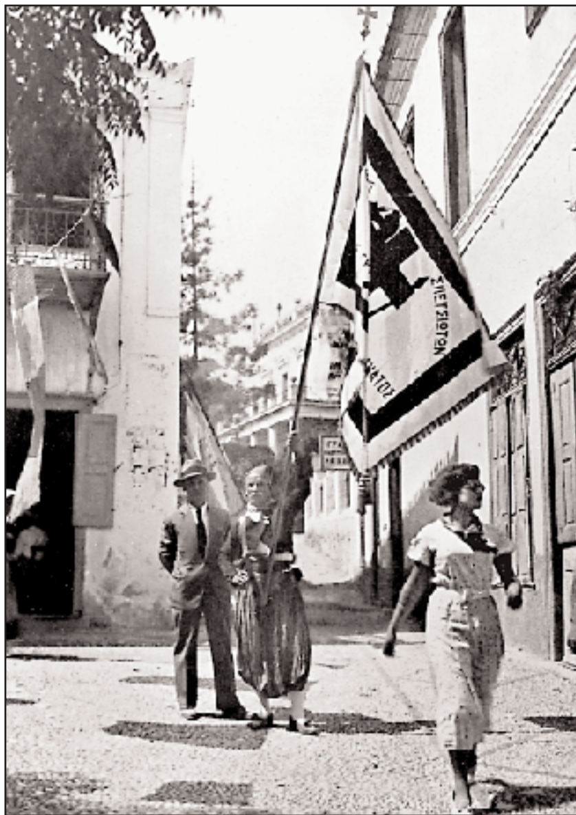
Βρακοφόρος Σπετσιώτης στον εορτασμό της εκατονταετηρίδας του νέου Ελληνικού Κράτους, σε βοτσαλόστρωτο δρόμο της Ντάπιας, Σπέτσες. Η σημαία είναι αντίγραφο της επαναστατικής σημαίας του νησιού.

Ναύπλιο. Οι Σπετσιώτες, έτοιμοι από μέρες, είχαν μεταφέρει τον άμαχο πληθυσμό στην απόκρημνη και φύσει οχυρή Υδρα και μόνον λίγοι υπεραπιστές παρέμειναν στο νησί, με επικεφαλής τον γηραιό πρωτάρχο Χατζηγιάννη Μέξη.