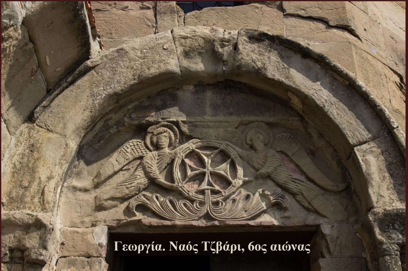
Γεωργία. Ναός Τζβάρι, 6ος αιώνας

Ο Πάπας (Πατριάρχης) Αλεξανδρείας της Κοπτικής Εκκλησίας Σενούντα Γ΄