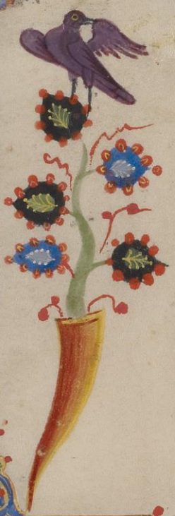
Κανών του 13ου αιώνα στα αρμενικά. Έργο του αγιογράφου Τόρος Ροσλίν