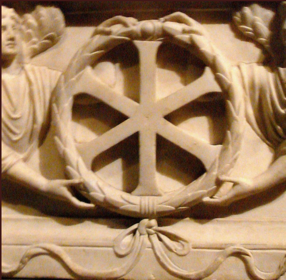
Κωνσταντινούπολη, 4ος αιώνας Αντιφωνίτισσα, στην κατεχόμενη Κύπρο