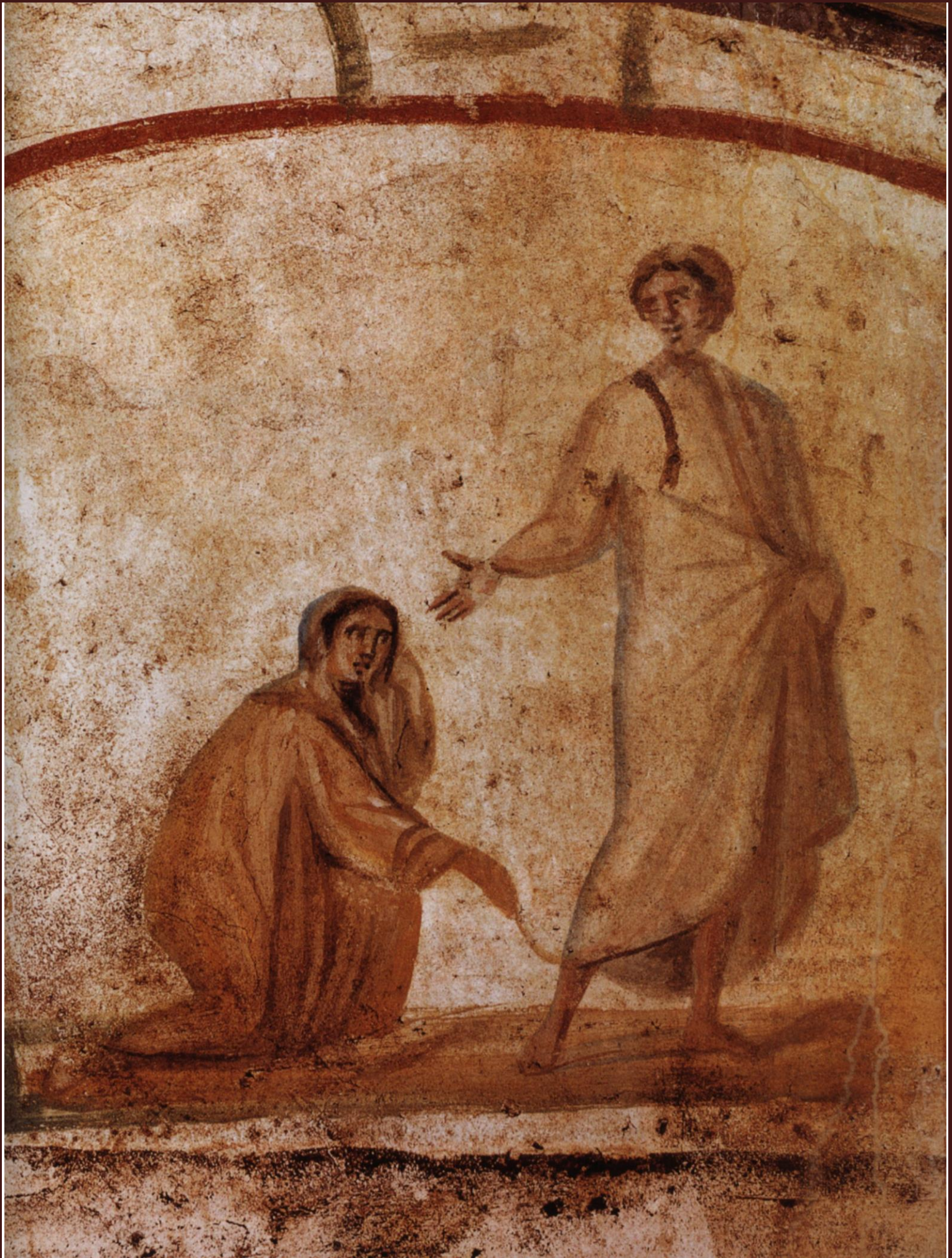
Ρώμη, τοιχογραφία στην Κατακόμβη του Μαρκελλίνου και Πέτρου: ο Χριστός και η αιμορροούσα γυναίκα, 4ος αιώνας