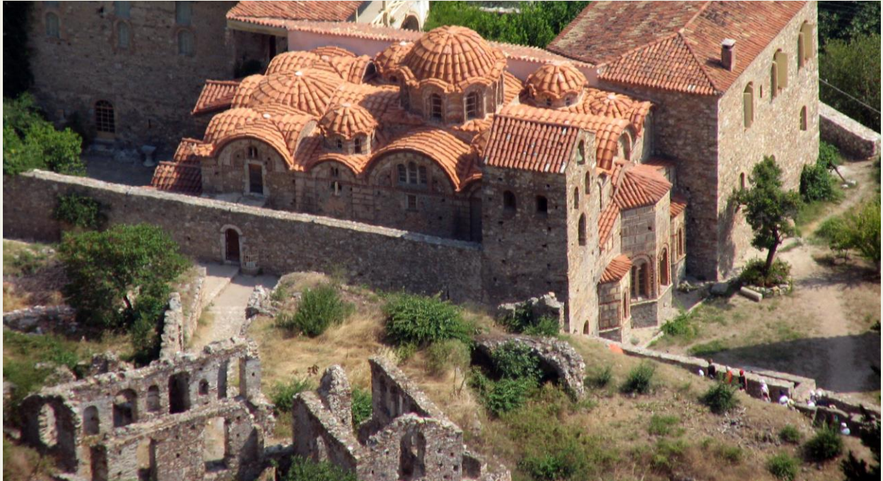
Μυστράς: Το μητροπολιτικό συγκρότημα και ο ναός του Αγίου Δημητρίου Με την ευκαιρία της εορτής του πολιούχου της Θεσσαλονίκης: Δύο από τα εμβληματικά ψηφιδωτά από τη βασιλική του Αγίου Δημητρίου