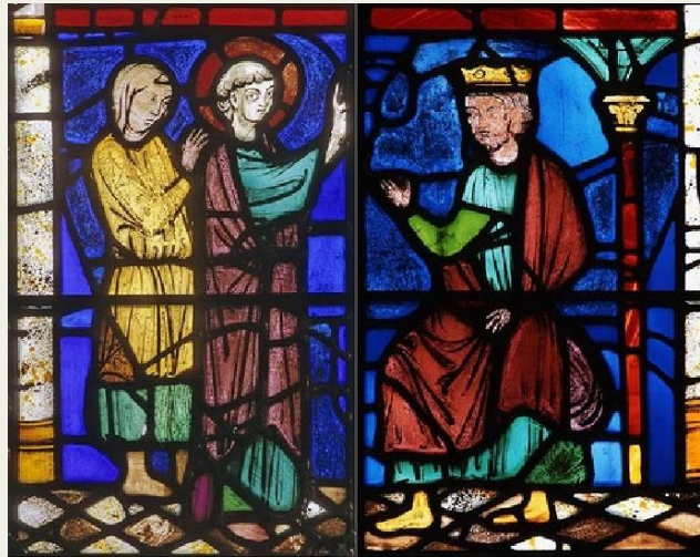
Βιτρώ (υαλογραφία με συνδετικό υλικό το μολύβι) στην Παναγία των Παρισίων, 13ος αιώνας.

>>> Μπορείτε να εγγραφείτε σε όλον τον κύκλο (έξι διαλέξεις) ή στο Πρώτο μέρος (τέσσερις διαλέξεις το 2017): Από τον θάνατο του Θεοδοσίου Α΄ το 395, την διχοτόμηση της Ρωμαϊκής Αυτοκρατορίας και την κατάρρευση του Δυτικού Τμήματος μέχρι τις παραμονές της Δ΄ Σταυροφορίας το 1200) ή μόνο στο Δεύτερο μέρος (δύο διαλέξεις τον Ιανουάριο του 2018): Από την ανάπτυξη των καστροπόλεων σε οχυρωμένες πολιτείες και την ίδρυση των πρώτων πανεπιστημίων έως το λυκαυγές της Αναγέννησης, 1200-1350.